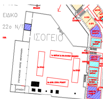
Κάτοψη Χώρου Καταφυγής (αύλειου χώρου)