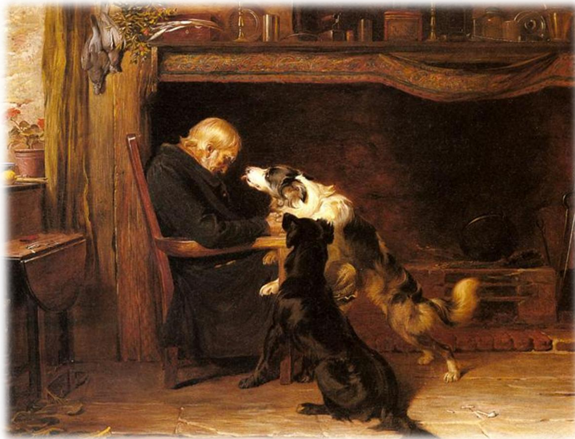
Sympathy, 1877 - Briton Riviere

Αξιοποιούμε κείμενα από την ύλη των μαθημάτων προκειμένου να αναμειχθεί διαχρονικά η σχέση του ανθρώπου με τα ζώα συντροφιάς. Για παράδειγμα τα παιδιά διαβάζουν και συζητούν με βάση τα κείμενα: