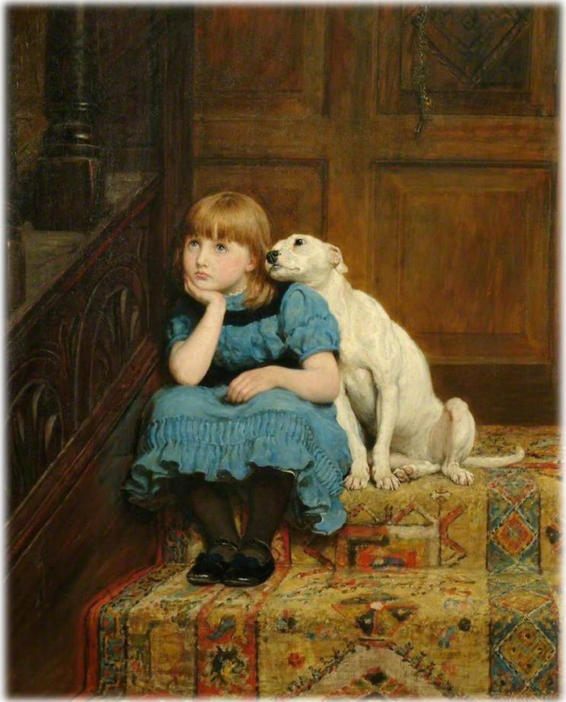
Britton Riviere, Sympathy