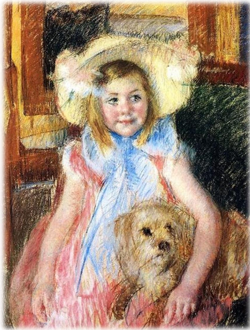
Mary Cassatt, Sara in a Large Flowered Hat Looking Right Holding Her Dog