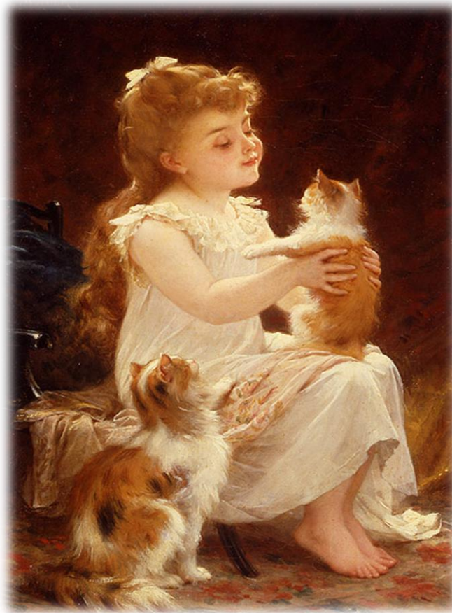
Emilie Munier-Playing with the kitten, 1893

Ο Emilie Munier ζωγράφισε και παρουσίασε μια σειρά από πίνακες με παιδιά και σκυλάκια ή γατάκια, μια πολύ πετυχημένη συλλογή που χρησιμοποιήθηκε και για διαφημιστικές αφίσες.