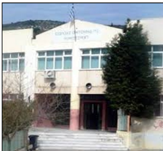
Το σχολείο μας

έχουμε βγει για ελεύθερο αλλά θα βγούμε την άλλη εβδομάδα. Ευχόμαστε να έχουμε ξανά την κυρία Νατάσσα. Αυτά είναι τα