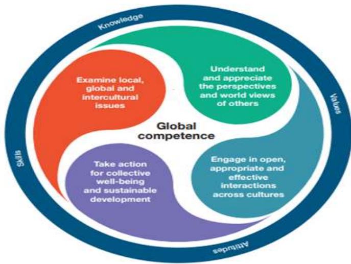
Figure 1. The dimensions of global competence

Το γλωσσικό επίπεδο του χρήστη καθορίζει τη σφαιρική του ικανότητα (Global competence) που έχει να κάνει με