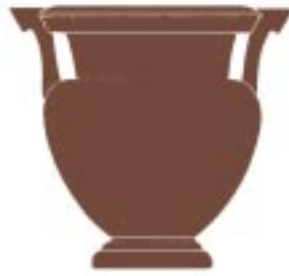
( ) Κρατήρας / Krater