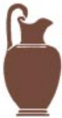
( ) Οινοχόη / Oinochoe