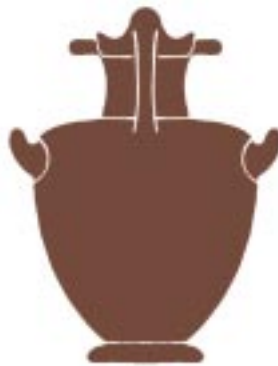
( ) Υδρία / Hydria