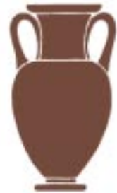
( ) Αμφορείς / Amphora