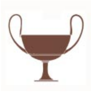
( 7 ) Κάνθαρος / Kantharos