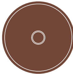
( ) Πινάκιο / Pinakion