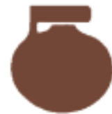
( 8 ) Αρύβαλλος / Aryballos