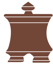
( 9 ) Πυξίς / Pyxis