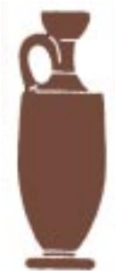
( ) Λήκυθος / Lekythos