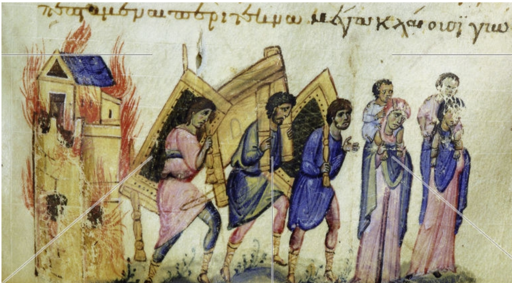
Μικρογραφία από βυζαντινό χειρόγραφο του 11ου αιώνα. Μαρκιανή Βιβλιοθήκη, Βενετία