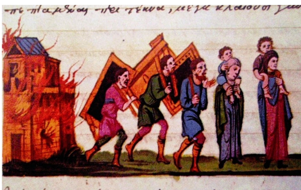
Μεταβυζαντινό χειρόγραφο, Παρίσι, Εθνική Βιβλιοθήκη

«Οι μετακινήσεις πληθυσμών και οι κοινωνικές αναστατώσεις της [υστεροβυζαντινής] εποχής έκαναν πολλούς ανθρώπους να νοιώθουν ξένοι στην ίδια τους τη χώρα. Έτσι, αρκετοί συγγραφείς τόνιζαν την ηθική αξία της φιλοξενίας και γενναιοδωρίας προς τον ξένο . Ο Γεννάδιος Σχολάριος [1400-1473], σε μια ομιλία του προς τους νέους, τόνιζε με έμφαση την εφαρμογή των ηθικών αξιών και τους παρότρυνε να δέχονται τους ξένους, για να μη γίνουν οι ίδιοι ξένοι για το Θεό κι ακόμη να τρέφουν τους πεινασμένους, γιατί σε τελευταία ανάλυση μια τύχη μας περιμένει όλους ».