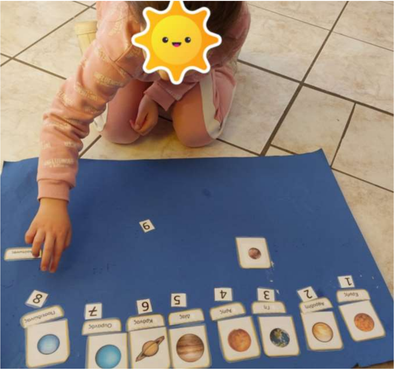
Εικόνες πλανητών