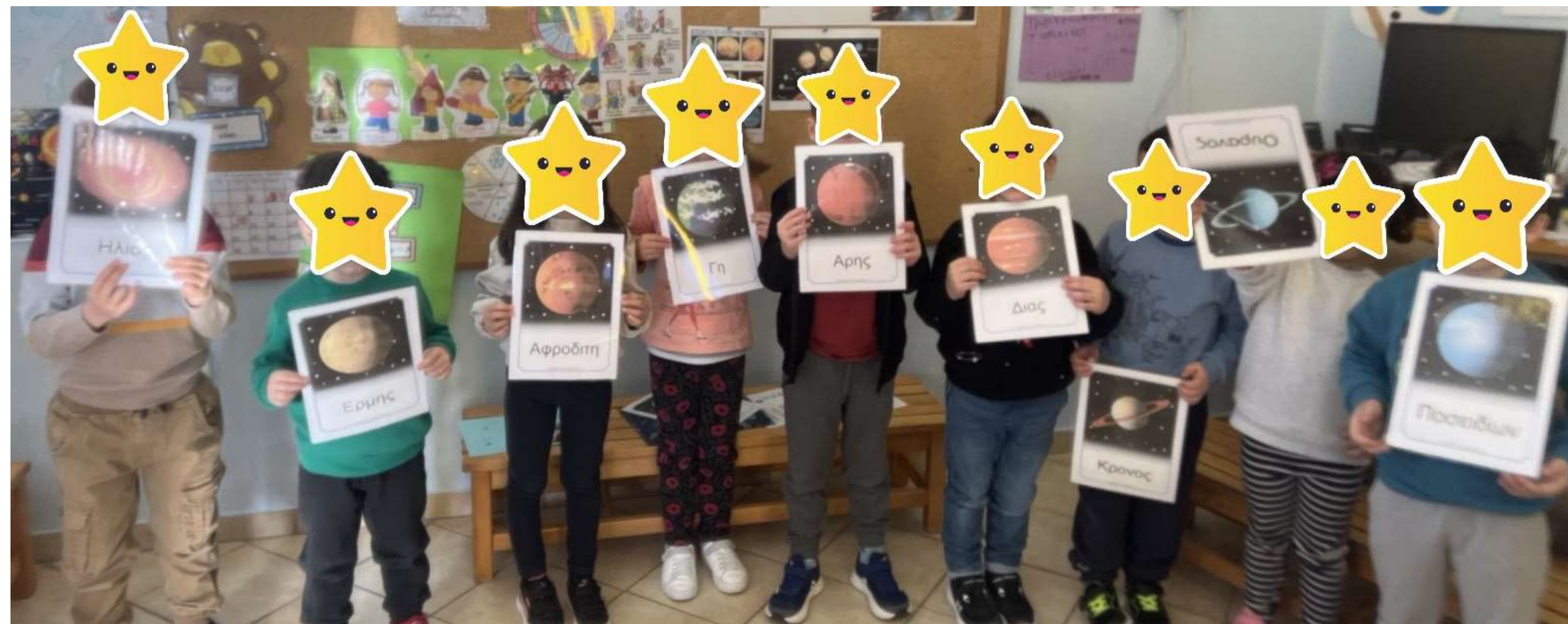
Εικόνες πλανητών