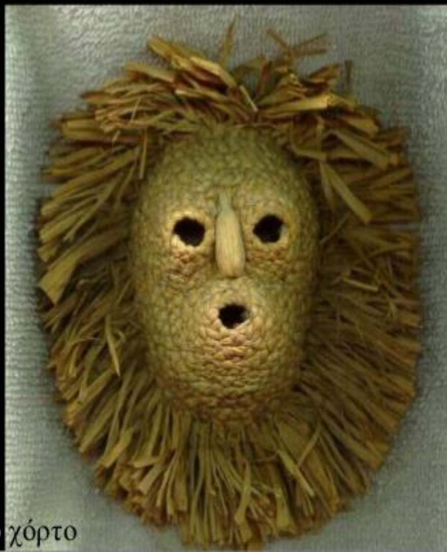
Αμερική, πλεγμένο χόρτο