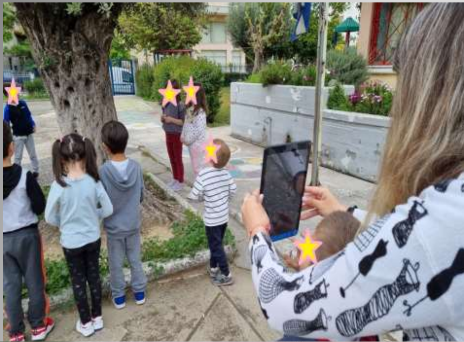
Τα δέντρα της αυλής μας