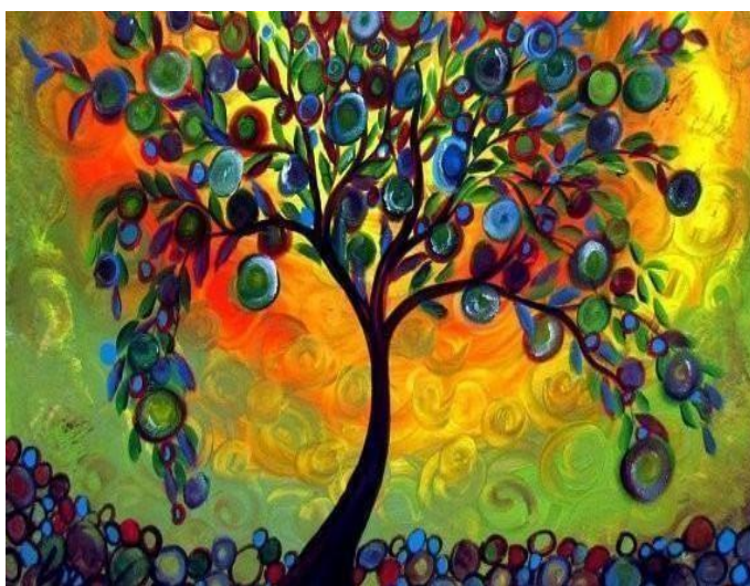
Το δέντρο που έδινε.pdf