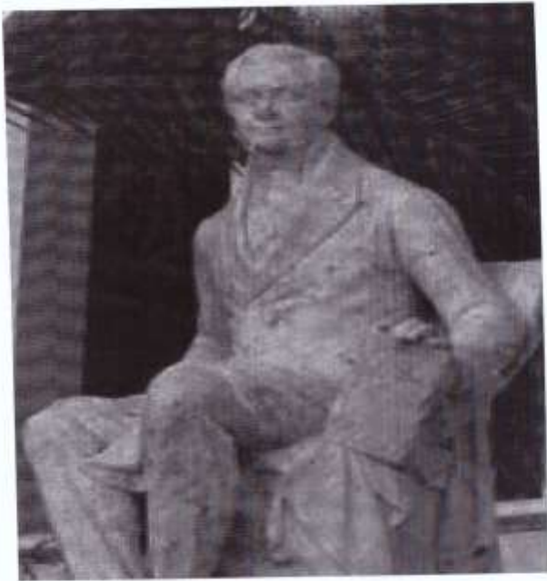
Άγαλμα του Ιωάννη Καποδίστριας, πρώτος κυβερνήτης της Ελλάδας, Αθήνα, Ελλάδα