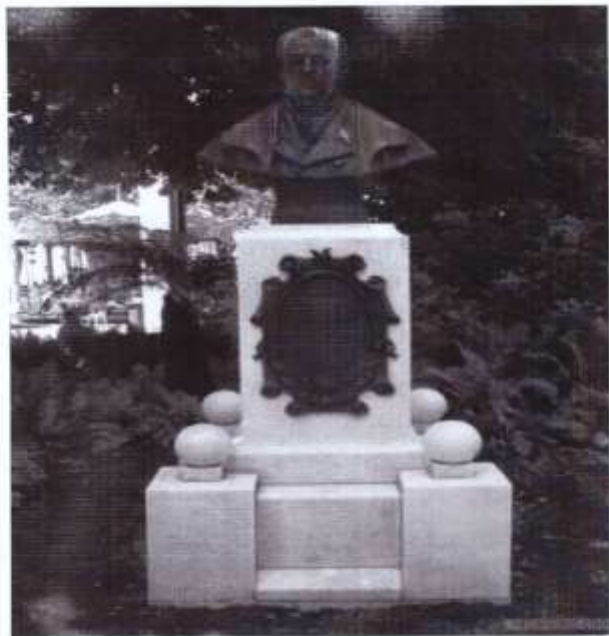
Το έργο του Ιωάννη Καποδίστρια στην Ελβετία