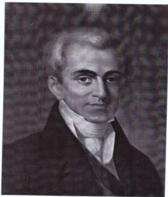
Ο Ιωάννης Καποδίστριας, πίνακας του Διονύσιου Τσόκου