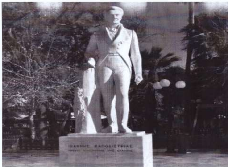
Το άγαλμα του Καποδίστρια στο Ναύπλιο