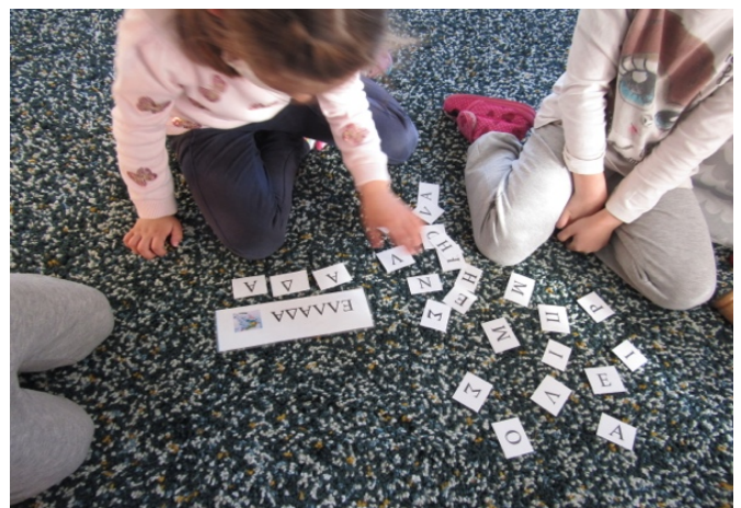
Σύνθεση της λέξης «Ελλάδα»