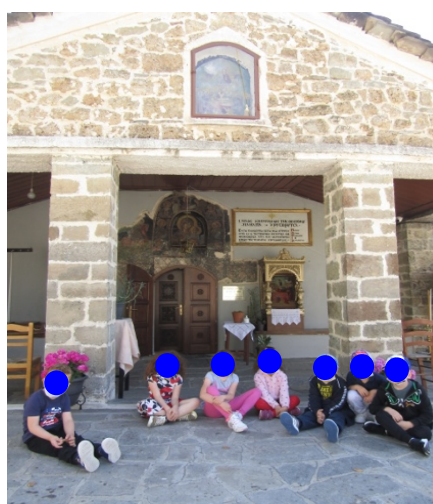
Επίσκεψη στην εκκλησία