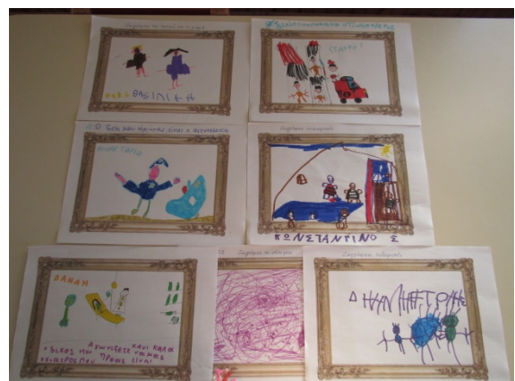
Διαγωνισμός Κυκλαδικής Τέχνης