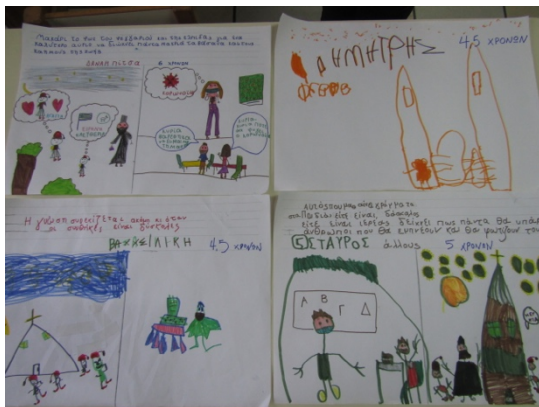
Διαγωνισμός Παιδικής Πινακοθήκης