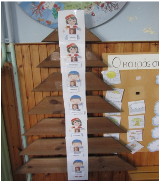
Ταμπλό της τάξης