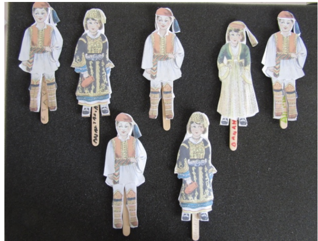
Χαρτοκοπτική με φορεσιές