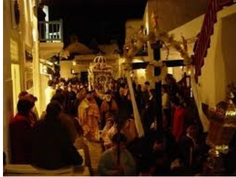
Περιφορά του Επιταφίου

Στην περιφορά του Επιταφίου προπορεύεται η μπάντα ή η χορωδία και παίζει πένθιμα εμβατήρια , ακολουθούν οι ιεροψάλτες, ο κλήρος, οι μυροφόρες, τα εξαπτέρυγα, πρόσκοποι και οι πιστοί που ψέλνουν καθ' όλη τη διάρκεια της λιτανείας. Σε όλη τη διαδρομή οι πιστοί ραίνουν τον επιτάφιο με λουλούδια και αρώματα, κρατώντας αναμμένα κεριά.