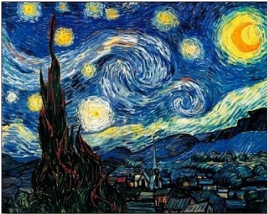
Έναστρο Νύχτα, Vincent Van Gogh

Χαμήλωσαν το ιπτάμενο χαλάκι τους. Τα σπίτια κάτω στο χωριό είχαν ακόμη αναμμένα φώτα. Ο ουρανός έλαμπε από άστρα που έμοιαζαν σαν να χόρευαν γύρω από τον εαυτό τους και το φεγγάρι κίτρινο και μεγάλο ήταν σαν ένας νυχτερινός ήλιος.