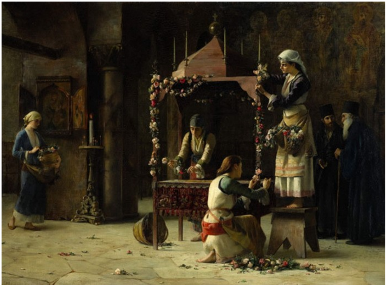
Η «Μεγάλη Παρασκευή» του Θεόδωρου Ράλλη

Πρόκειται για ελαιογραφία σε καμβά που χρονολογείται από την εποχή που οι ικανότητες του Ράλλη ως ζωγράφου της καθημερινής ζωής βρίσκονταν στο απόγειό τους. Απεικονίζει μια εκκλησία κατά τη διάρκεια των προετοιμασιών για το Πάσχα με τέσσερα κορίτσια να δουλεύουν μαζί για να στολίσουν έναν Επιτάφιο με λουλούδια, ενώ δύο ιερείς συζητούν.