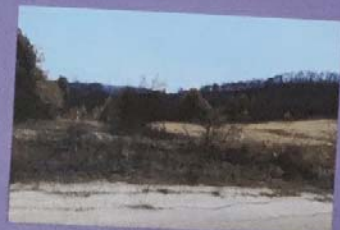
ΦΩΤΟ ΟΜ. 12 ΕΠΙΛ. ΑΕ ΟΥΡΑΝΟΥ