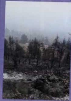
Φωτογραφία του 40 Διαμέρισμα 1180000