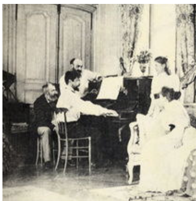
Ο Ντεμπουσσύ στο πιάνο, 1893.

στέρησε το σχετικό βραβείο. Τη διάκριση όμως την απέσπασε ο Ντεμπουσσύ από τα μαθήματα της συνοδείας με πιάνο, και της «πρακτικής αρμονίας» (prima vista), όπου είχε την δυνατότητα να επιδείξει το ταλέντο του στον αυτοσχεδιασμό. Το 1883, ο Ντεμπουσσύ έλαβε μέρος στον διαγωνισμό για το Βραβείο της Ρώμης ("Prix de Rome") της γαλλικής Ακαδημίας Καλών Τεχνών, που για τον τομέα της σύνθεσης είχε ως έπαθλο υποτροφία τριετούς φοίτησης στη Βίλα των Μεδίκων στη Ρώμη, ύψιστη διάκριση για έναν φιλόδοξο συνθέτη εκείνη την εποχή. Η κριτική επιτροπή όμως του απένευσε το δεύτερο βραβείο. Παρολ' αυτά, έλαβε πάλι μέρος την επόμενη χρονιά (1884), καταθέτοντας την καντάτα L'enfant prodigue (Ο άσωτος υιός,) και πήρε την υποτροφία.