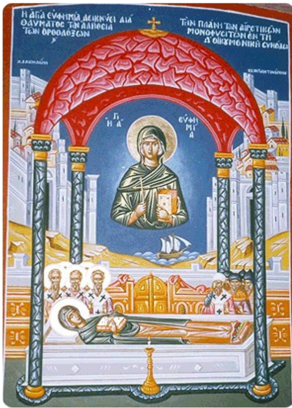
Η αγία Ευφημία

«αιρέσεις» θα δοθούν τα ψέματα και θα ελκυστούν στην αλήθεια της σωτηρίας δια του Ιησού Χριστού.