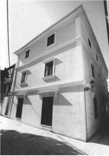
Οικία Κόνδαρη, στην οδό Κόνταρη (τώρα ανακατασκευασμένη στεγάζει τη Φιλαρμονική Λευκάδας). Στην παλαιά οικία στεγάστηκε το Ελληνικό Σχολείο (1919-1922, 1923-1929).