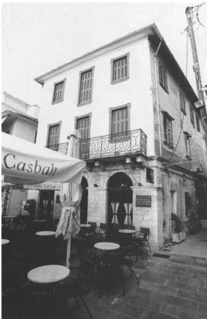
Οικία Αρταβάνη στην Κεντρική πλατεία. Στέγασε το Ελληνικό Σχολείο (1922-1923).