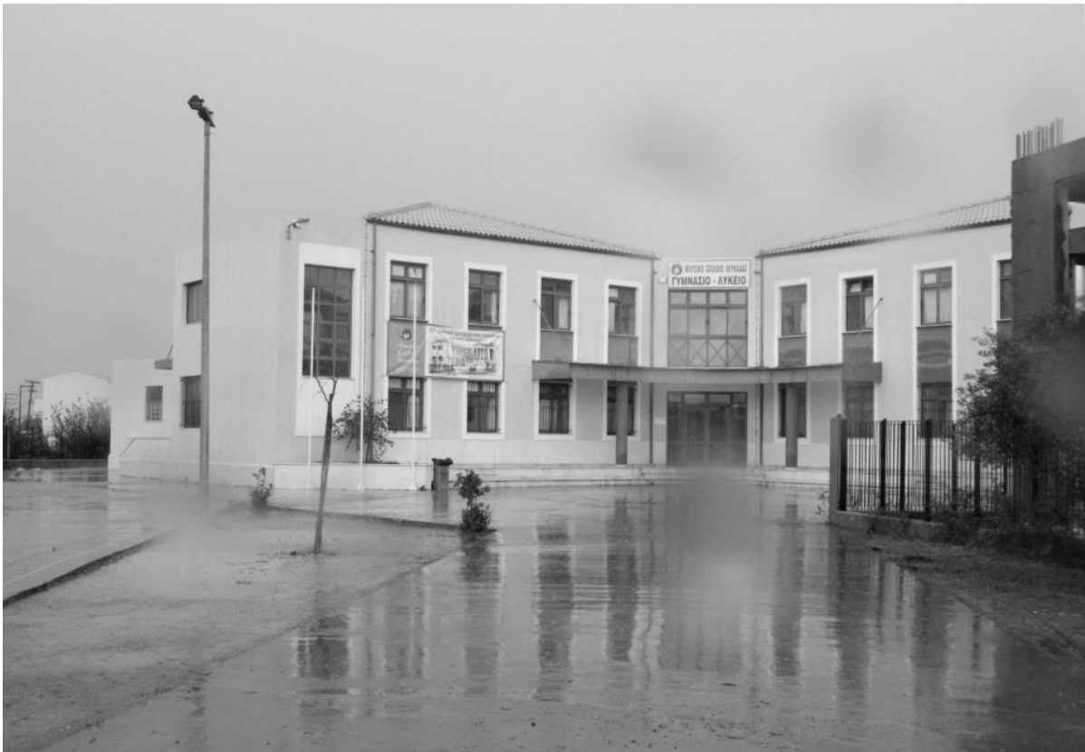
Μουσικό Σχολείο Λευκάδας, Λεωφόρος Φιλοσόφων, 31100 Λευκάδα. Νεόδμητο κτίριο. Στεγάζει το Μουσικό Σχολείο Λευκάδας από το Σεπτέμβριο του 2009.