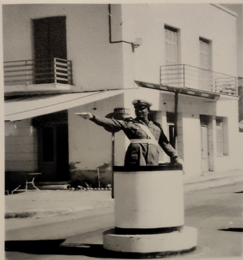
Δαμασκηνού & Εθν. Ανεξαρτησίας