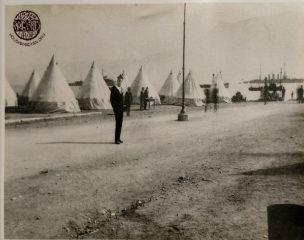
Κόρινθος, 1928. Λίγες μέρες μετά τον σεισμό.jpg