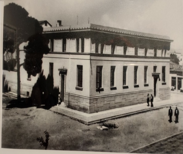
Δικαστικό Μέγαρο Κορίνθου..jpg