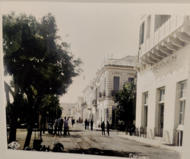
1924. Η οδός Δαμασκηνού στην Κόρινθο..jpg