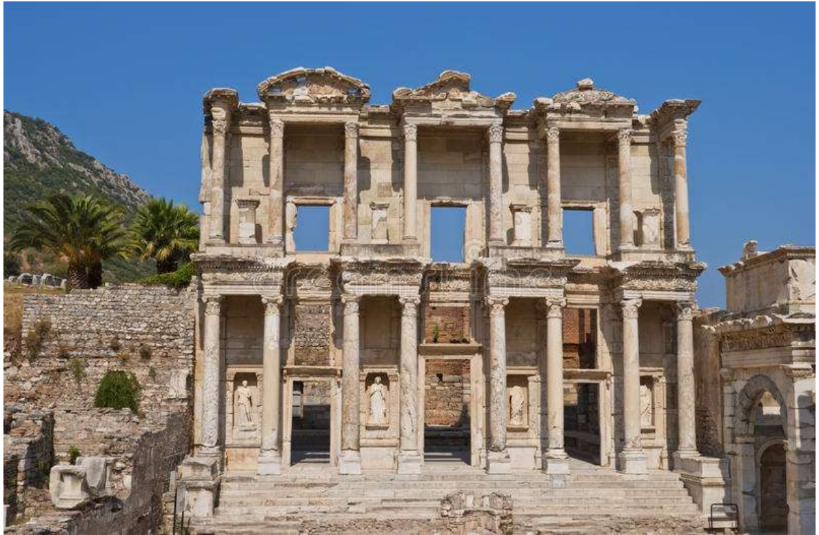
Βιβλιοθήκη του Κέλσου