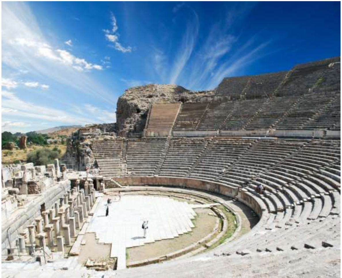
Αρχαίο Θέατρο Εφέσου