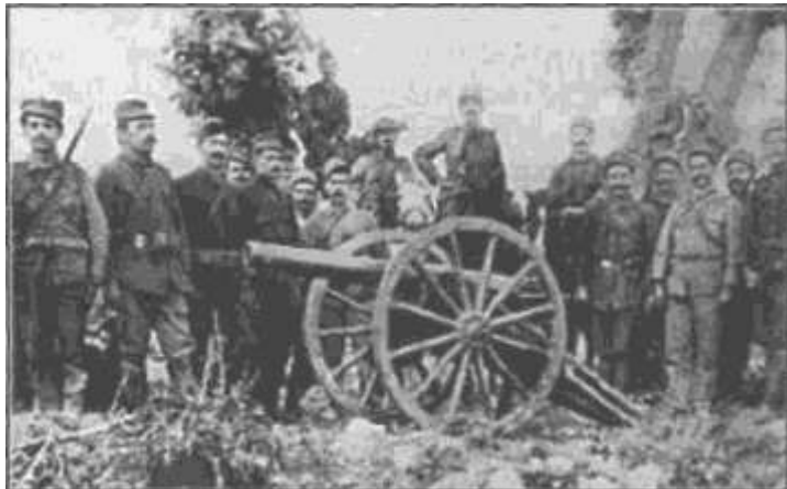
Έλληνες στρατιώτες φωτογραφίζονται Έλληνες στρατιώτες φωτογραφίζονται με περηφάνια, στη διάρκεια των βαλκανικών πολέμων

Συγχρόνως η Χ Μεραρχία διάβηκε τον Αξιό στη Μποέμιτσα και μετά από σφοδρή επίθεση κατά του εχθρού στην αριστερή όχθη, τον απώθησε. Επίσης, η ομάδα των τεσσάρων μεραρχιών που βρισκόταν στο κέντρο, πολεμώντας με πείσμα σε όλη τη διάρκεια της ημέρας «εκέρδισε βήμα προς βήμα άπαν το προς νότον του Κιλκίς έδαφος εκατέρωθεν του ποταμού Γαλλικού και της σιδηροδρομικής γραμμής, έφθασε δε μετά πολλών μεν απωλειών, αλλά μετ' ανδρείας απαράμιλλου εις 5 έως 6 χιλιομέτρων απόστασιν από της οχυρωμένης τοποθεσίας του Κιλκίς. Κατά την θριαμβευτική ταύτην προέλασιν ο Ελληνικός Στρατός έκαμε χρήσιν της λόγχης δι' ης εξετόπισε τον εχθρόν εκ των χαρακωμάτων αυτού, ων αι τάφροι ευρέθησαν πλήρεις βουλγαρικών πτωμάτων.» 10