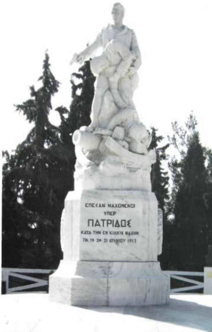
Το Ηρώον του Κιλίκις. Αιώνια μνήμη και δόξα για αυτούς που έπεσαν μαχόμενοι υπέρ πατρίδος.