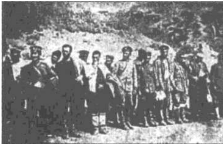
Βούλγαροι αιχμάλωτοι στην περιοχή 'Σαχταρίνας', 500 μέτρα νότια της σημερινής πόλης Κιλκίς.

«Αξιωματικοί και στρατιώται πίπτουν ο εις εις το πλευρόν του άλλου, άλλος εδώ, άλλος εκεί, άλλος παρέκει... Στρώνεται το έδαφος από ανθρώπινα πτώματα. Αλλά άλλοι προχωρούν αδιακόπως. Μικρά απόστασις χωρίζει τους δύο εχθρούς. Αλλ' οι Βούλγαροι ανθί-