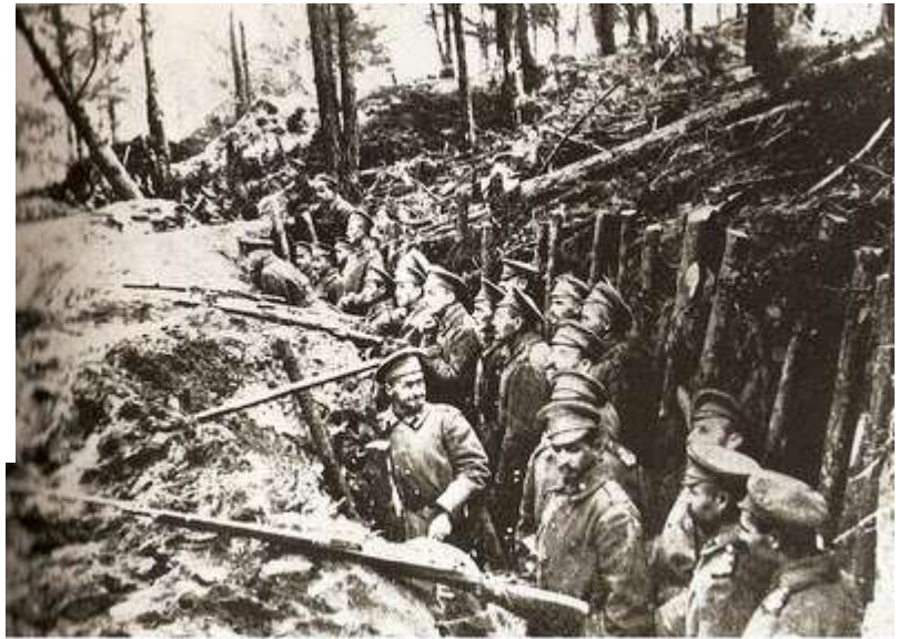
Οι Βούλγαροι στα χαρακώματα των υψωμάτων του Λαχανά.

«Η επίθεση κατά της Νιγρίτας, η παρασπονδία κατά του Παγγαίου, η ιεροσυλία κατά του θωρηκτού 'Αβέρωφ', οι σφαγές και πυρπολήσεις και ατιμώσεις, η διαπόμπευση και απάνθρωπος τυραννία των συλληφθέντων 17 Ελλήνων στρατιωτών, η παραφρόνηση Ελληνίδων δασκάλων από τα βουλγαρικά μαρτύρια, όλα εκείνα τα αλλεπάλληλα αίσχη και θηριωδίες τους, που διάβαζε καθημερινά ο στρατός, η διεκδίκηση πόλεων που βάφτηκαν με αίμα των αγωνιστών υπέκαυσαν τα παλιά μίσση κατά των δολοφόνων της Μακεδονίας και προπαρασκεύασαν με μεγάλη ένταση το ηθικό του στρατού... Στις 15 Ιουνίου περιτρέχοντας τα τρία συντάγματα της Μεραρχίας, ήταν σαν να έβλεπα ότι βρισκόμουν μπροστά σε μια συνωμοσία, χωρίς οργα-