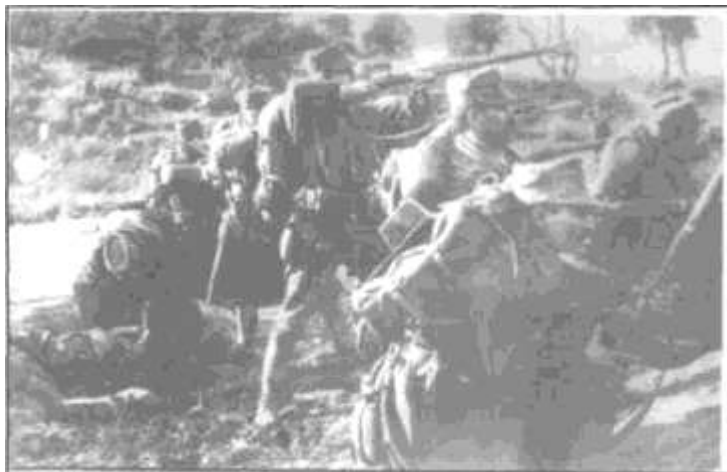
Έλληνες στρατιώτες στην πρώτη γραμμή με τις λόγχες τοποθετημένες στα στόμια των τουφεκιών.

«Και το Κιλκίς το αλαζονικόν, το απόρθητον Κιλκίς που θα εγίνετο ο τάφος της Ελλάδος, ασπαίρει τώρα υπό τους γαμπούς όνυχας των λιονταριών της Ε' Με-