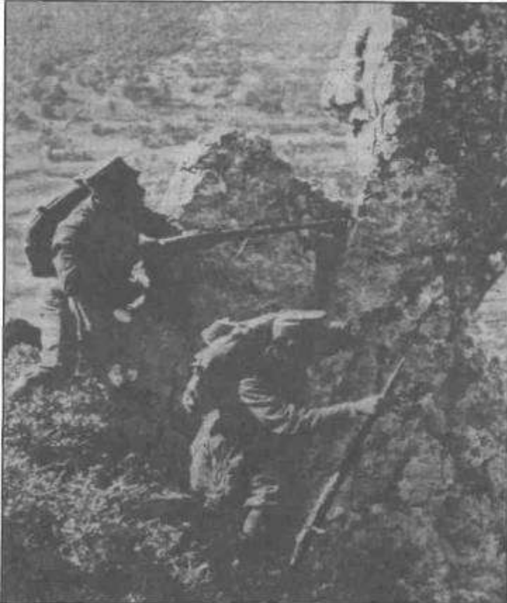
Μακεδονία, η Ιστορία του Κιλκίς.

«Κατά πληροφορίαν αιχμαλώτου Βουλγάρου εσκοπείτο την νύκταν ταύτην αιφνιδιασμός κατά του ημετέρου στρατεύματος εμποδισθείς λόγω της προελάσεως ημών. Η τοιαύτη πληροφορία φαίνεται αληθής, καθόσον το ημέτερον στράτευμα