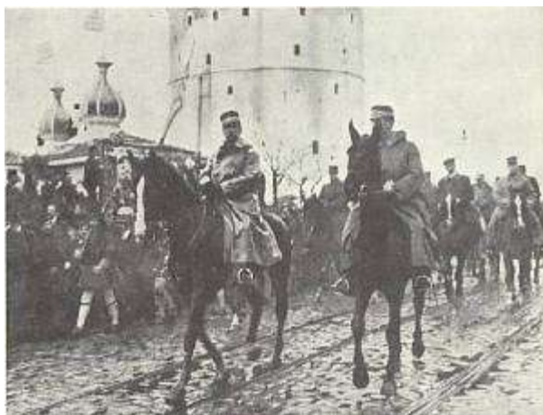
Γεώργιος και Κωνσταντίνος εισέρχονται στη Θεσσαλονίκη

Η απελευθέρωση της Θεσσαλονίκης είναι πια γεγονός.