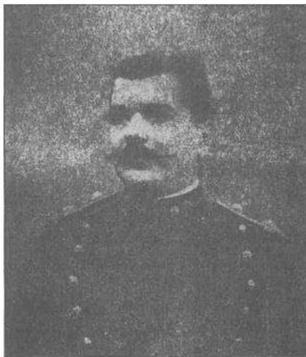
Ο ήρωας αντισυνταγματάρχης Κορομηλάς, έπεσε στη μάχη του Κιλκίς.

Οι ελληνικές δυνάμεις έπρεπε να προσβάλουν και να εκπορθήσουν θέσεις, φυσικά οχυρωμένες που ενισχύθηκαν με χαρακώματα και προστατευμένες σχεδόν από παντού από εδαφικές δυσχέρειες που έκαναν αδύνατη την ταχεία και ελεύθερη χρήση του πυροβολικού. Έτσι, κατασκευάστηκαν δρόμοι τάχιστα από το Μηχανικό τμήμα. Πέρα από όλα αυτά ο ελληνικός στρατός είχε να αντιμετωπίσει τον εχθρό που αμυνόταν με αριθμητική ισότητα και σε ορισμένες περιπτώσεις με υπεροπλία έναντι των Ελλήνων. Οι Βούλγαροι είχαν αντιτάξει τέσσερις πλήρεις μεραρχίες την 3η, 6η, 11η, 13η, και μια ταξιαρχία της 10ης Μεραρχίας,