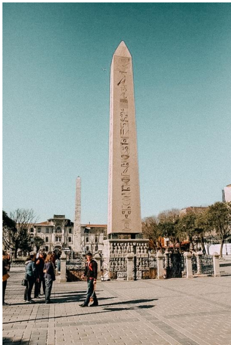
ΙΠΠΟΔΡΟΜΟΣ ΚΩΣΤΑΝΤΙΝΟΥΠΟΛΗΣ ΟΚΤΩΒΡΙΟΣ 2022