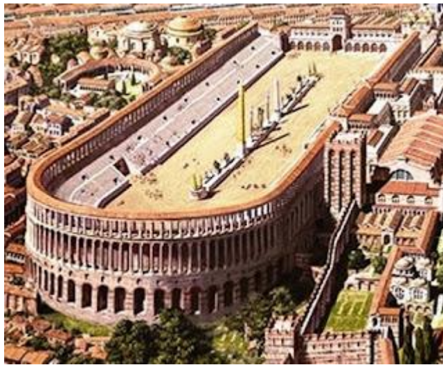
ΙΠΠΟΔΡΟΜΟΣ ΚΩΝΣΤΑΝΤΙΝΟΥΠΟΛΗΣ ΤΗΣ ΤΟΤΕ ΕΠΟΧΗΣ

Τα βασικά θέματα που αναγνωριζόταν από το νόμο ήταν: Το πένταθλον (πάλη, πυγμαχία, άλμα, δρόμο, και δίσκος) , ακόντιο, τόξο, άρση βαρών και σφαίρα. Περισσότερα δημοφιλή αγωνίσματα ήταν το άλμα εις μήκος, η πάλη και το ακόντιο ενώ παραδοσιακοί αθλητικοί χώροι, όπως η παλαίστρα, αυτό το στάδιο και το γυμνάσιο συνέχιζαν να χρησιμοποιούνται. Ο χώρος όμως που έλκυε πιο πολύ τους κατοίκους ήταν ο ιππόδρομος όπου γίνονταν αγώνες δρόμου, αντοχής, αρματοδρομίες κ.α. Σχεδόν όλες οι μεγάλες πόλεις της τότε αυτοκρατορίας διέθεταν ιππόδρομο ενώ ο πιο ξακουστός ήταν της Κωνσταντινούπολης.