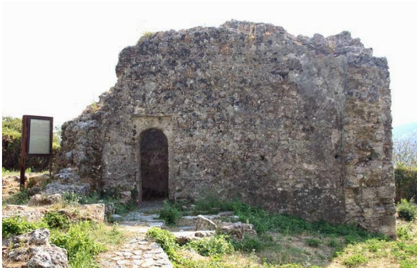
Βυζαντινό λουτρό Παραμυθιάς

Στην Ελλάδα βρίσκονται συνολικά 6 βυζαντινά λουτρά. Ένα από αυτά είναι της Παραμυθιάς, ένα δημόσιο λουτρό που χρονολογείται στην μεσοβυζαντινή περίοδο (8 ος -12 ος αι). Παρόμοιο του είναι και αυτό της Θεσσαλονίκης (13 ος αι). Ένα ακόμα είναι αυτό των Ιωαννίνων που βρίσκεται στο εσωτερικό του σύγχρονου οικισμού του κάστρου. Το μισό του λουτρού δυστυχώς έχει καλυφθεί από το τοπικό δημοτικό σχολείο.