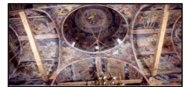
Εικ. Μονή Βαρλαάμ – Καθολικό Τρούλος & καμάρες

Κι ακόμα οι αδελφοί Αψαράδες, τα αρχοντόπουλα απ' τα Γιάννενα (οι επόμενοι ιερομόναχοι Νεκτάριος και Θεοφάνης) , που έκαναν 22 χρόνια υπομονή μέχρι ν' ανεβάσουν τα υλικά για να χτίσουν το καθολικό της Μονής Βαρλαάμ. Εποχή που ούτε νερό δεν υπήρχε πάνω στο βράχο. Μαρτυρία γι' αυτές τις “βασιλικές ανέσεις” των πρώτων οικιστών των Μετεώρων είναι το βαρέλι δώδεκα τόνων, μέσα στο οποίο συγκέντρωναν το νερό της βροχής στη Μονή Βαρλαάμ η οποία οφείλει το όνομα της στον ασκητή Βαρλαάμ, ο οποίος πρώτος κατοίκησε τον βράχο το 14ο αι 2 . Ανάμεσα στα κειμήλια ξεχωρίζει το Ευαγγέλιο που ανήκε στον βυζαντινό αυτοκράτορα Κωνσταντίνο τον Πορφυρογέννητο. Το καθολικό της μονής είναι ένας δικώνιος σταυροειδής εγγεγραμμένος, αθωνικού τύπου, ναός. Του κυρίως ναού προηγείται ευρύχωρη λιτή, ένας