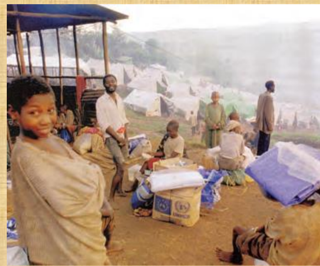
Καταυλισμός προσφύγων της Ύψτης Αρμουςτίας του Ο.Η.Ε. για τους πρόσφυγες