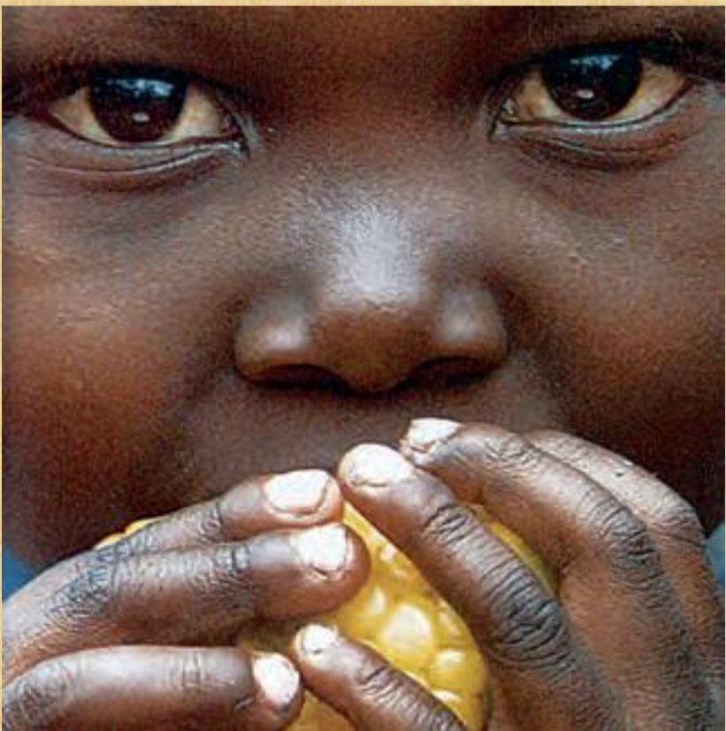
Ο υποσιτισμός μαστίζει τον τρίτο κόσμο

Τα ανθρώπινα δικαιώματα, αφενός, αφορούν στην ανάπτυξη των ανθρωπίνων όντων, δηλαδή, πώς μπορούν να αξιοποιήσουν πλήρως τις δυνατότητές τους σε σχέση με τους συμπολίτες τους. Από την άλλη, τα ανθρώπινα δικαιώματα καθορίζουν τις υποχρεώσεις του κράτους προς τους πολίτες. Στα σημαντικά έγγραφα για τα ανθρώπινα δικαιώματα περιλαμβάνονται η Οικουμενική Διακήρυξη για τα Δικαιώματα του Ανθρώπου, η Ευρωπαϊκή Σύμβαση των Δικαιωμάτων του Παιδιού. Παραδοσιακά, τα ανθρώπινα δικαιώματα έχουν χωριστεί σε κατηγορίες – ατομικά, πολιτικά, κοινωνικά, οικονομικά και πολιτιστικά. Αυτές οι κατηγορίες συνδέονται με τα στάδια ανάπτυξης στην ιστορία των ανθρωπίνων δικαιωμάτων, με τα ατομικά και πολιτικά δικαιώματα να θεωρούνται "πρώτης γενιάς", τα οικονομικά και κοινωνικά δικαιώματα ως "δεύτερη γενιάς" και τα πολιτιστικά ή δικαιώματα ανάπτυξης ως "τρίτης γενιάς". Με επιφύλαξη για την αξία κατηγοριοποίησης των δικαιωμάτων, η EDC/HRE επιδιώκει την κατανόηση των ανθρωπίνων δικαιωμάτων. Δίνει την ίδια έμφαση σε όλες τις κατηγορίες: ατομικά, πολιτικά, κοινωνικά, οικονομικά και πολιτιστικά. Έτσι, η EDC/HRE προσπαθεί να εξισορροπήσει την τάση του παρελθόντος να θεωρούνται κάποια δικαιώματα σημαντικότερα από κάποια άλλα.