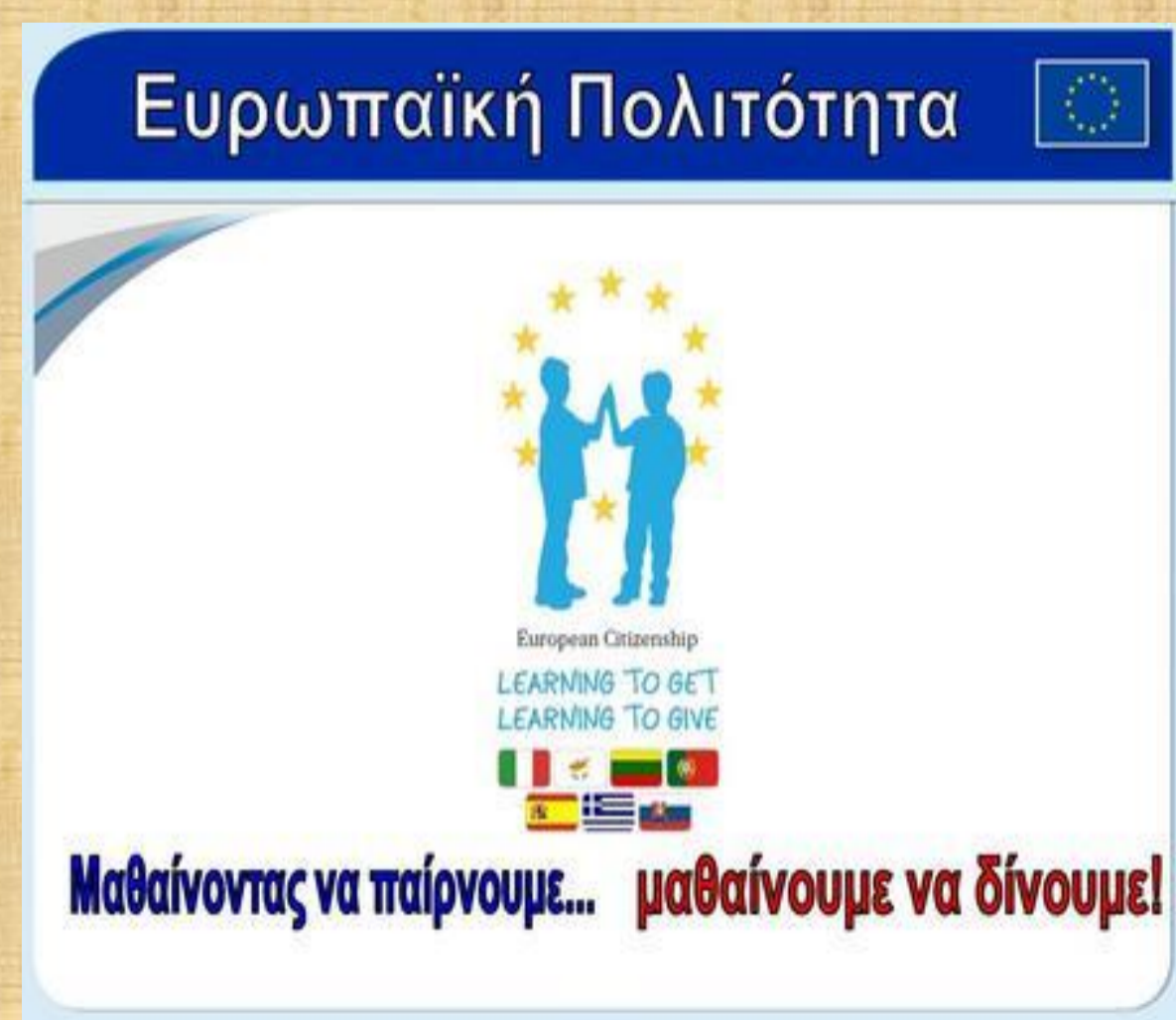
Δικαιώματα και Υποχρεώσεις

Μια κριτική και ανθρωπιστική προσέγγιση της σχέσης δικαιωμάτων-υποχρεώσεων είναι αναγκαία και είναι σημαντικό να κινηθεί η έρευνα προς αυτή την κατεύθυνση. Επίσης είναι απαραίτητη η έρευνα για την αποτελεσματική αντιμετώπιση της καταπάτησης των ανθρωπίνων δικαιωμάτων.