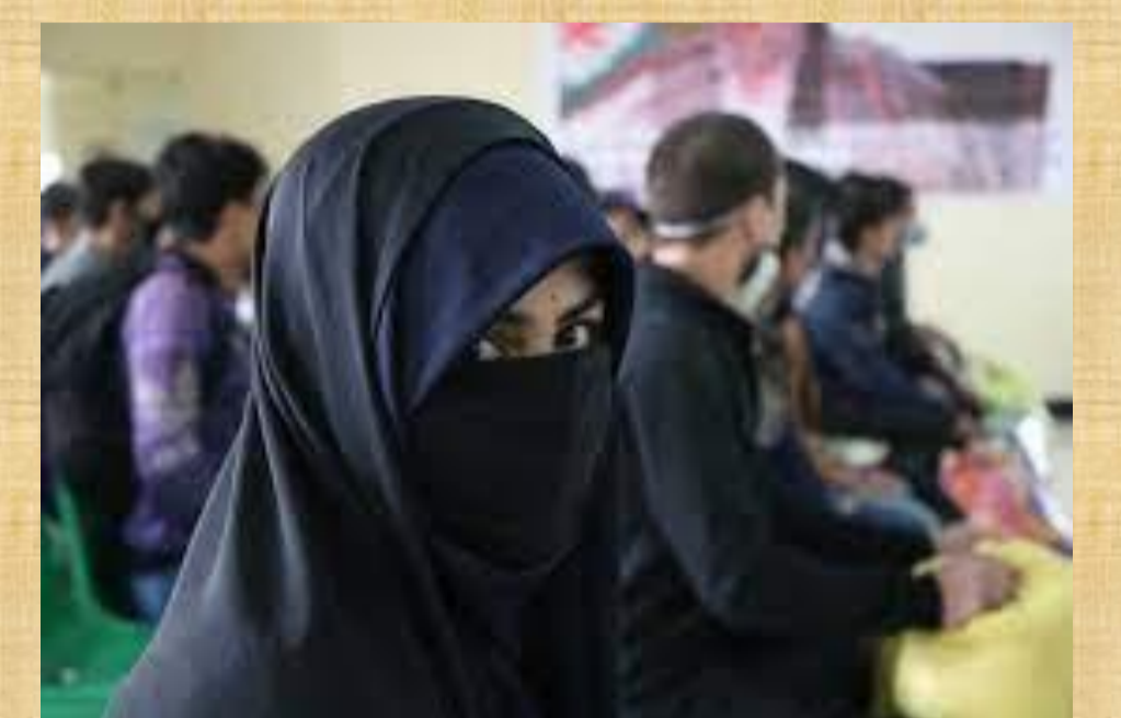
Ο ΟΗΕ καταγγέλλει τη συστηματική καταπάτηση των δικαιωμάτων των γυναικών