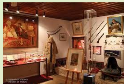
Μουσείο Αλή πασά στο νησάκι