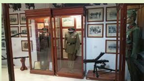
Πολεμικό Μουσείο στο Καλπάκι