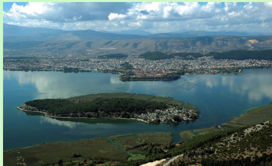
άποψη των Ιωαννίνων από ψηλά

Τα Ιωάννινα είναι πόλη της Ηπείρου, έδρα του Δήμου Ιωαννιτών και πρωτεύουσα της Περιφερειακής Ενότητας Ιωαννίνων.