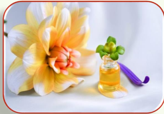
Από την αρχαιότητα ως σήμερα