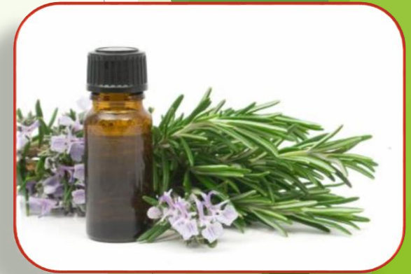
Μύθοι και παραδόσεις