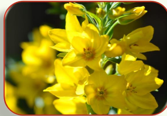
Φαρμακείο της φύσης