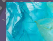
Πάσης φύσεως προϊόντα που διασπώνται σε μικροπλαστικά (οξοδιασπώμενα)