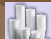
Περίεκτες ποτών από φελιζολ