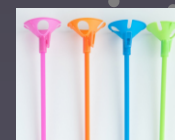
Στηρίγματα για μπαλόνια