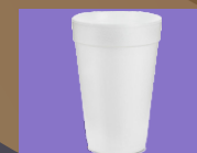
Κυπελάκια ποτών από φελιζολ