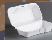
Περίεκτες τροφίμων από φελιζολ