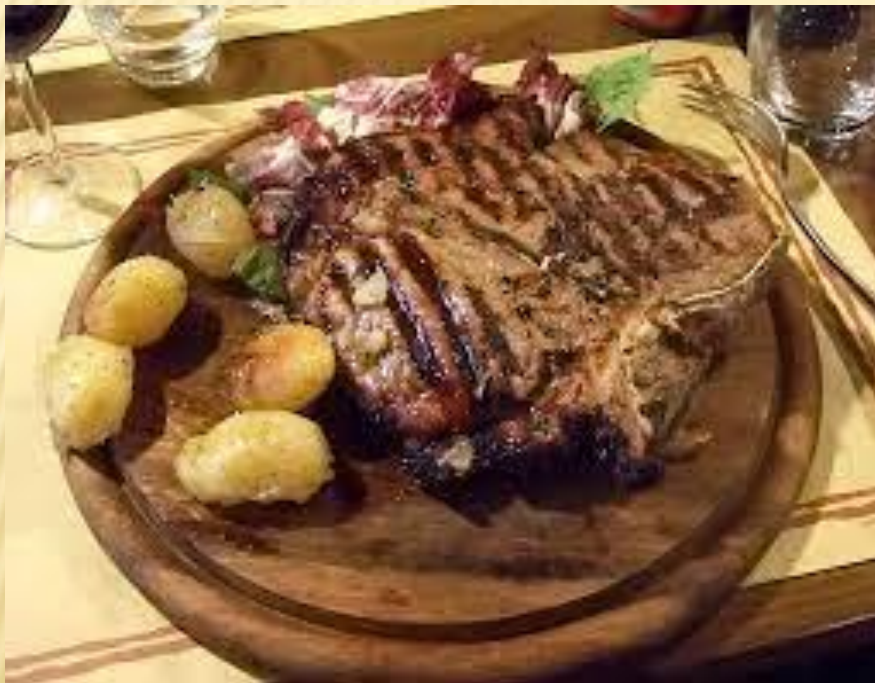
Bistecca alla fiorentina