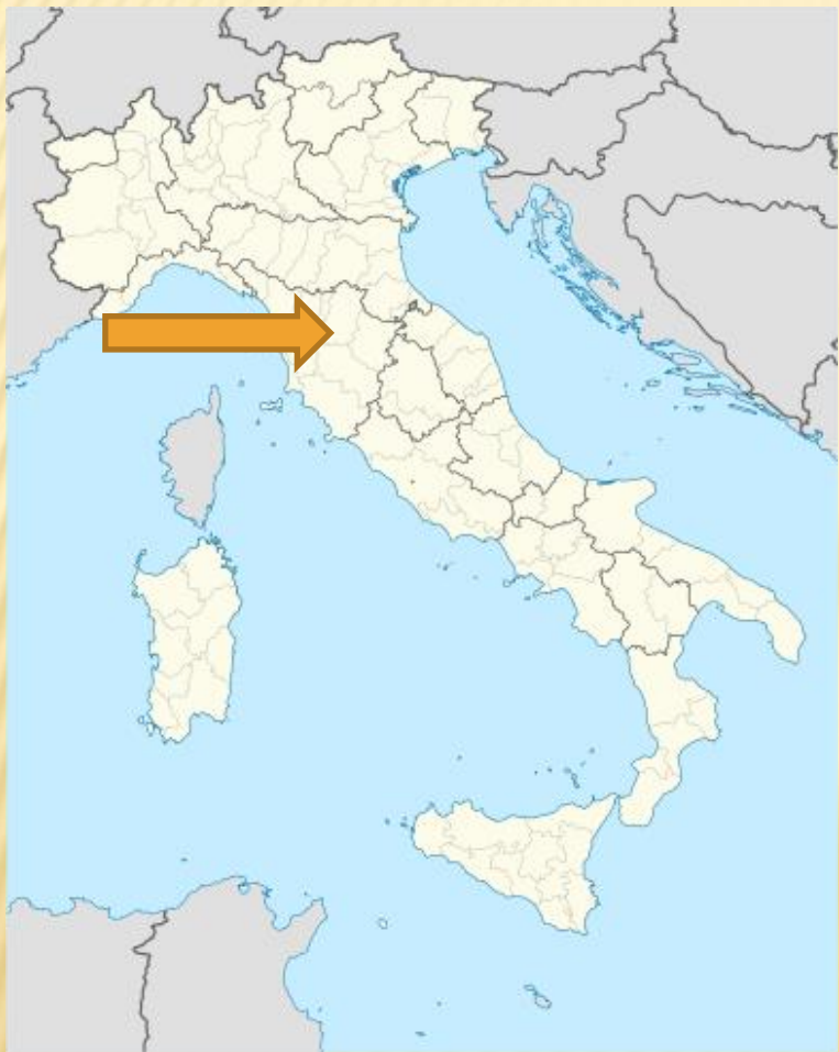
Η Φλωρεντία στην Ιταλία