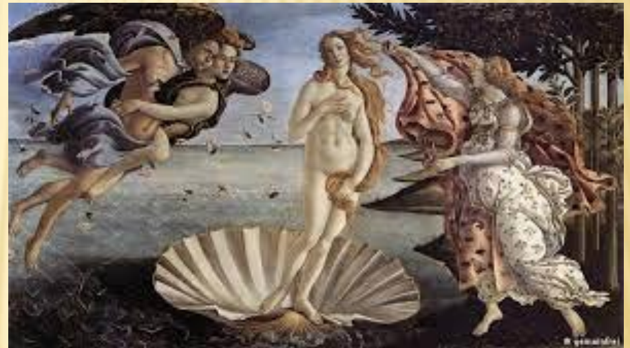
Η Γέννηση της Αφροδίτης