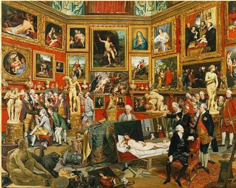
Η Tribuna του Uffizi-Πίννακας του Johann Zoffany