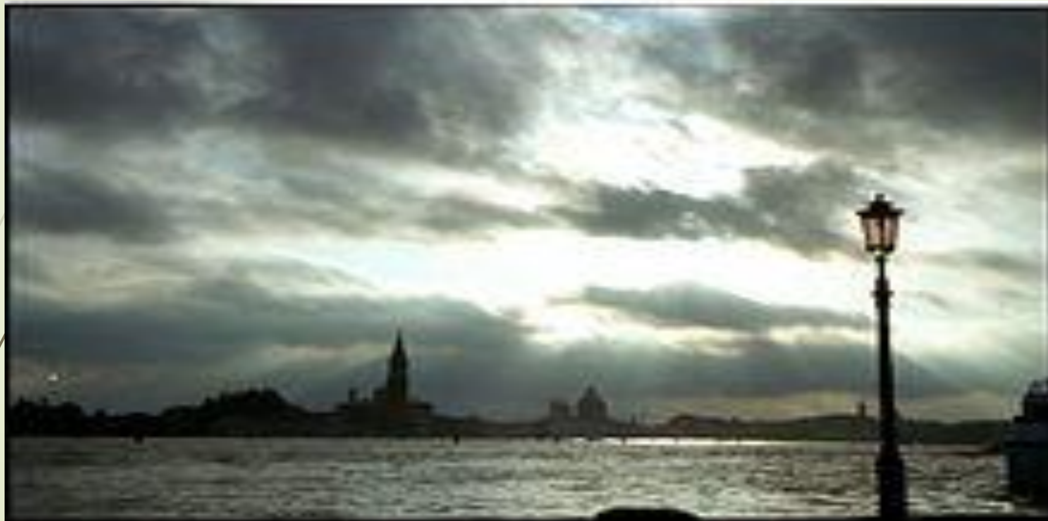
Φωτογραφία της Βενετίας κατά το ηλιοβασίλεμα