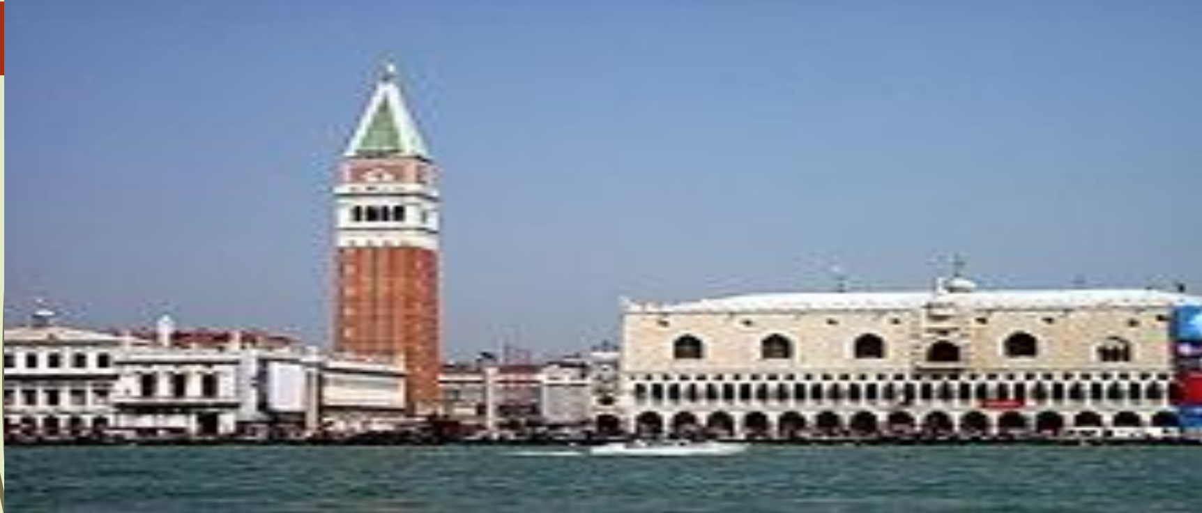
Η Πλατεία του Αγίου Μάρκου και το Παλάτι των Δόγηδων

Η Βενετία είναι μία ρομαντική, τουριστική πόλη, απαράλλακτη στο χρόνο. Είναι ένας από τους σημαντικότερους τουριστικούς προορισμούς στον κόσμο για τις φημισμένες της τέχνες και αρχιτεκτονική. Η πόλη δέχεται έναν μέσο όρο 50.000 τουριστών την ημέρα (εκτίμηση 2007 ). Θεωρείται ως μία από τις ομορφότερες πόλεις στον κόσμο.