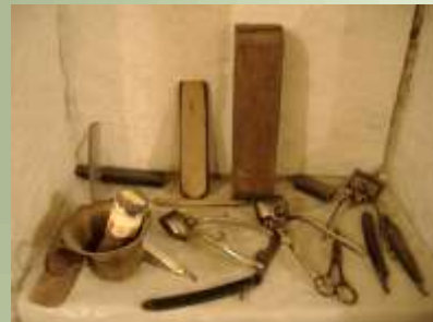
Εργαλεία του μπαρμπέρη

Τώρα σπάνια έρχεται κάποιος για ξύρισμα. Οι περισσότεροι κάνουν το ξύρισμα μόνοι τους στο σπίτι και στον κουρέα έρχονται μόνο για κούρεμα.