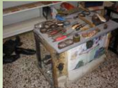
Εργαλεία του τσαγκάρη

Όλοι τώρα κοιτάζουν να μάθουν γράμματα και αυτή είναι μία τέχνη που πρέπει να την παραλάβεις από τον πατέρα σου για να μπορέσεις να την συνεχίσεις: δεν υπάρχει κάποιο μέρος που μπορείς να την μάθεις, οπότε οι νέοι δεν είναι εύκολο να ασχοληθούν με αυτήν.