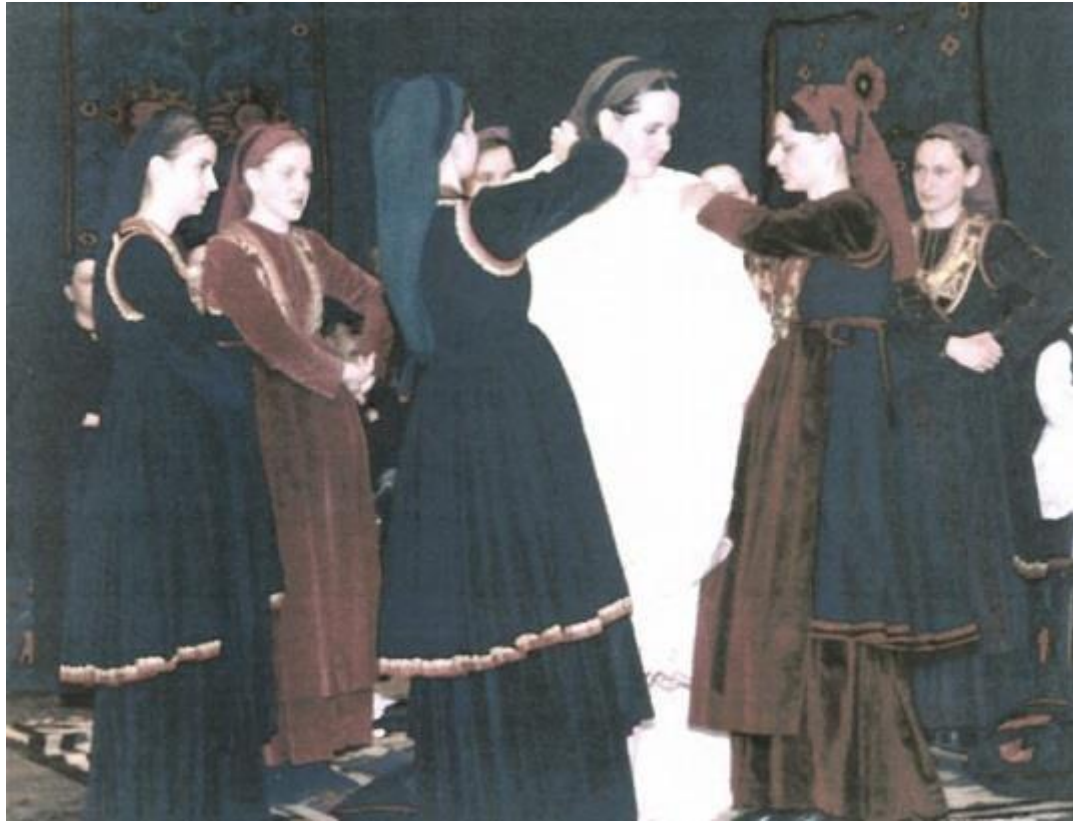
ΤΟ ΣΤΟΛΙΣΜΑ ΤΗΣ ΝΥΦΗΣ ΑΠΟ ΤΙΣ ΦΙΛΕΝΑΔΕΣ ΤΗΣ. (ΑΝΑΠΑΡΑΣΤΑΣΗ ΒΛΑΧΙΚΟΥ ΓΑΜΟΥ ΑΠΟ ΣΥΛΛΟΓΟ ΒΛΑΧΩΝ ΒΕΡΟΙΑΣ)

Στο μαντήλι καρφισώνουν και τη σκέπη για να καλύπτει το πρόσωπό της όταν θα την πάρουν για τα στέφανα. Τη νυφική στολή πληρώνει στο ράφτη ο πατέρας της νύφης. Κι ο γαμπρός, αν έχει τη δυνατότητα, ράβει ένα φουστάνι στη νύφη που θα το φορέσει τη Δευτέρα, όταν θα πάει στη βρύση για νερό. Κατά την τελετή του νυφοστολισματος, όλες οι φιλενάδες της τραγουδούν συγκινητικά τραγούδια, που περιγράφουν το στόλισμα και λένε για τη δυσκολία του αποχωρισμού της νύφης από τους δικούς της. Απαγορεύεται να τη δουν οι άντρες και οι νέοι. Σε μια γωνιά κάθεται η μάνα της νύφης ντυμένη κι αυτή με την παραδοσιακή φορεσιά. Στο μεταξύ αρχίζουν κι έρχονται οι γυναίκες απ' όλο σχεδόν το χωριό για ευχές και το «κέρασμα». Το κέρασμα είναι τα λεφτά. Πιάνουν το χέρι της νύφης και εκείνη, με τη σειρά της, από σεβασμό και εκτίμηση, φιλάει το χέρι των γυναικών που την κερνούν. Τα λεφτά η νύφη τα δίνει αμέσως στη μάνα της, η οποία τα βάζει στο μαξιλάρι. Οι ευχές είναι εγκάρδιες : – «σε κερνώ απ' την καρδιά μου». – «στ' άσπρα να σε δω». Δίπλα από τη μάνα της νύφης κάθεται ένα παιδί, συνήθως αγόρι, και γράφει το ονοματεπώνυμο ξεχωριστά κάθε γυναίκας, που έρχεται για κέρασμα και το αντίστοιχο ποσό