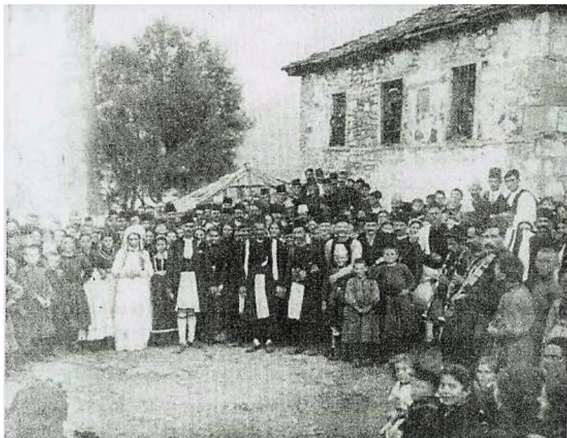
Η ΝΥΦΗ ΣΤΟ ΣΠΙΤΙ ΤΟΥ ΓΑΜΠΡΟΥ ΜΕΤΑ ΤΑ ΣΤΕΦΑΝΑ – ΣΑΜΑΡΙΝΑ (1911)

(κουφέτα) και ρύζι, που βρίσκονται στο δίσκο του παιδιού και ραίνουν το ζευγάρι. Στο τέλος του μυστηρίου ο πεθερός και η πεθερά της νύφης αρχικά, πλησιάζουν το ζευγάρι και το φιλούν πρώτα στο μέτωπο και ύστερα στα μάγουλα. Η νύφη τους φιλά το δεξί χέρι και της δίνουν ένα