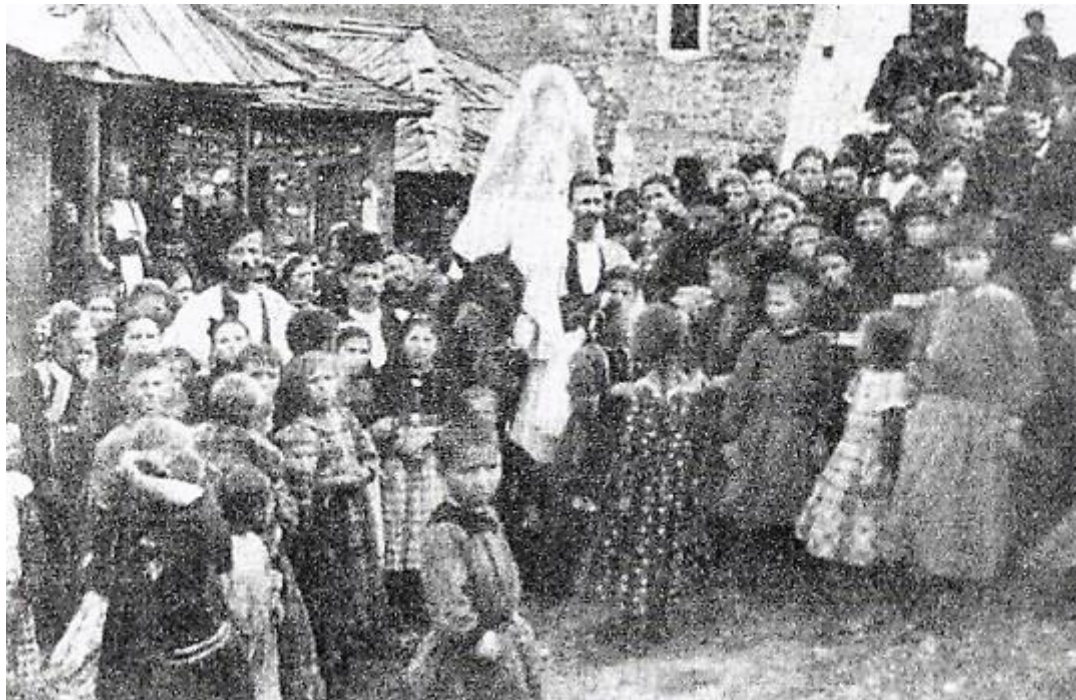
ΟΙ ΣΥΜΠΕΘΕΡΟΙ ΠΑΙΡΝΟΥΝ ΤΗ ΝΥΦΗ – ΣΑΜΑΡΙΝΑ (1911)

«- έβγα κόρη στην αυλή σου – για κοντοκαρτερείτε να πατώ στη σκάλα, να ριχτώ στη σέλα ν' αποχαιρετήσω τον καλό πατέρα, την καλή μου μάνα, τα καλά αδερφάκια, τα καλά ξαδέρφια».