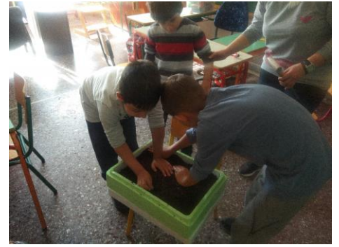
1. Βάζω χώμα και το απλώνω...