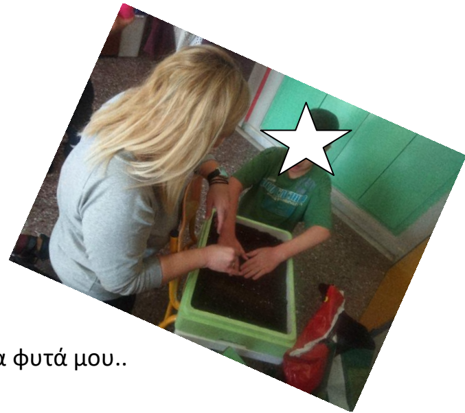
2. Φυτεύω με προσοχή τα φυτά μου..