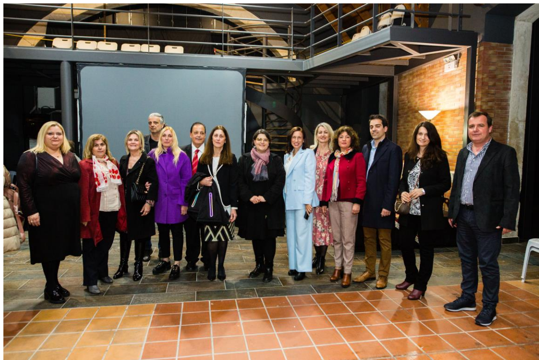
Σύλλογος Διδασκόντων του 13 ου Δημοτικού σχολείου Πατρών