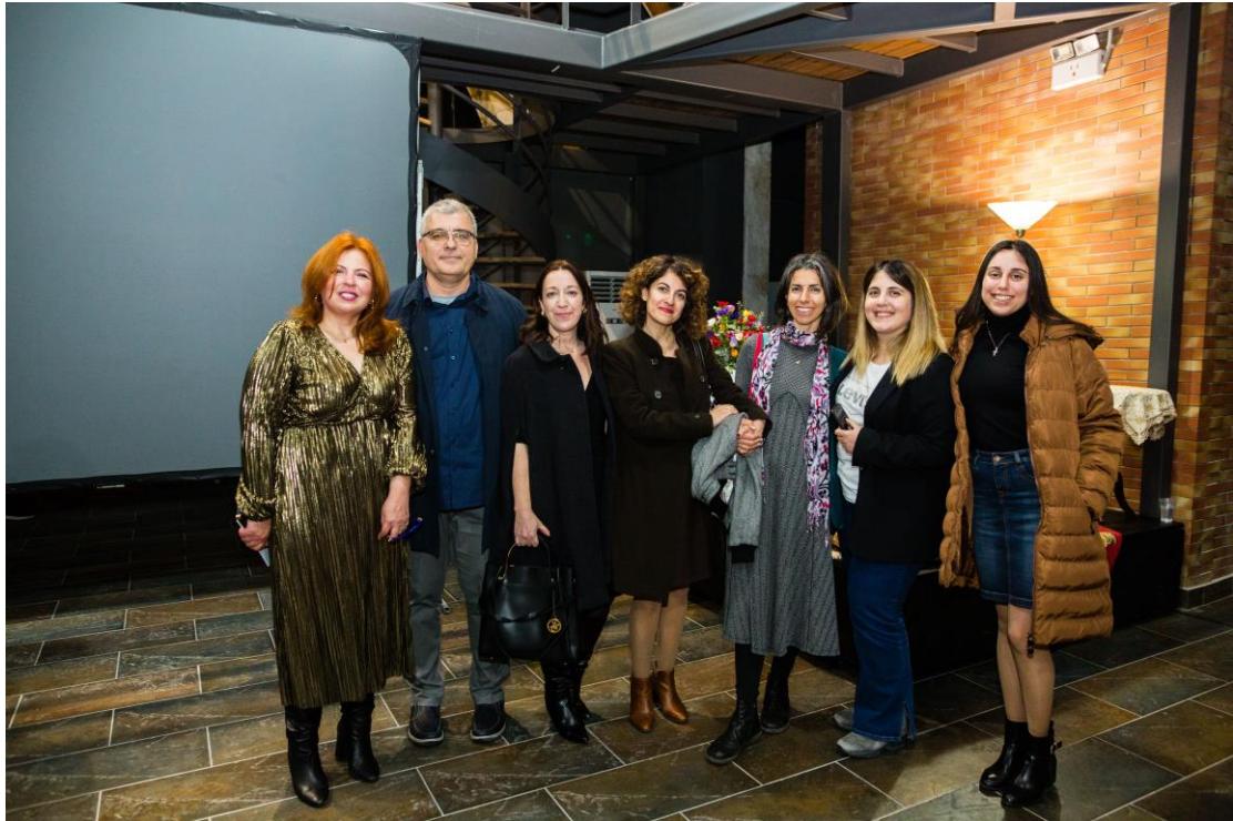
Μέλη του Συλλόγου Διδασκόντων του 1 ου Δημοτικού Σχολείου Πατρών