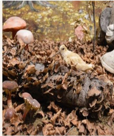
Λεπτομέρεια από το Μανιταροδάσος