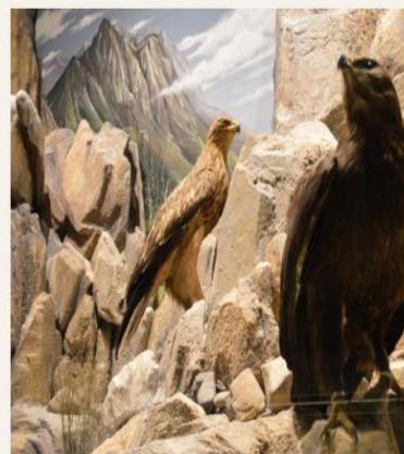
Λεπτομέρεια από το διόραμα "Η άγρια ζωή σε βουνά και βράχια"