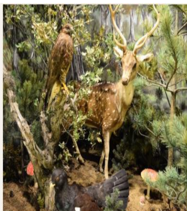
Λεπτομέρεια από το διόραμα "Δάση"