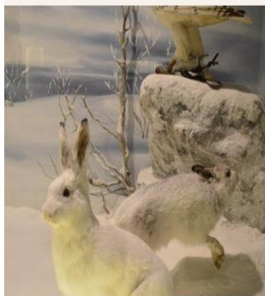
Λεπτομέρεια από το "Αρκτικό" διόραμα