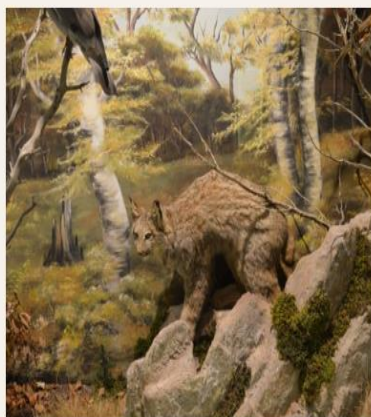
Λεπτομέρεια από το διόραμα "Μικρό Δάσος"