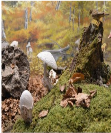
Στο Μανιταροδάσος της Οξιιάς