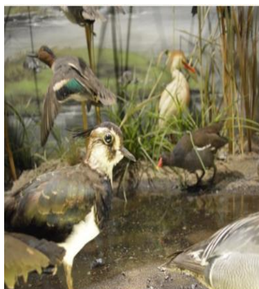
Λεπτομέρεια από τον Υδροβιότοπο