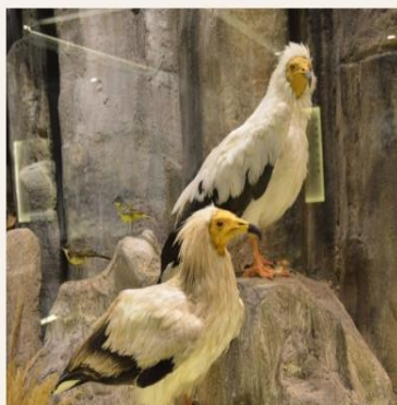
Λεπτομέρεια από το διόραμα των Μετεώρων