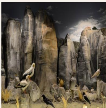
Το διόραμα των Μετεώρων

Πρόκειται για έναν σημαντικής αξίας συμβολισμό, αφού αναδεικνύουν την δυνατότητα αρμονικής συνύπαρξης της ανθρώπινης δραστηριότητας με τη φύση και τα οικοσυστήματά της.