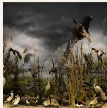
Το διόραμα του Υδροβιότοπου