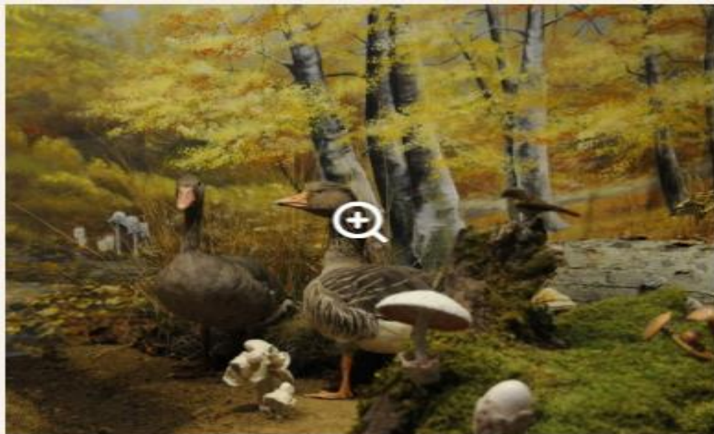
Λεπτομέρεια από το Μανιταροδάσος