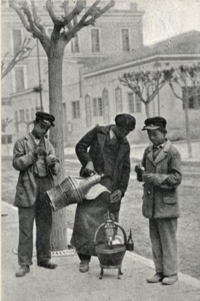
Νικάνδρα - Δήμητρα

Ο σαλεπιτζής ήταν από τους "γραφικούς" τύπους των πλανόδιων πωλητών, παρόμοιος με τον παγωτατζή, δεδομένου ότι περιφερόταν κι αυτός ντυμένος πάντα στα άσπρα (φορούσε άσπρη μπλούζα και καπέλο, συνήθως όπως αυτό του μάγειρα). Η δουλειά του άνηθε τις πρωινές και τις βραδινές ώρες, δηλ. το ακριβώς αντίθετο με την δουλειά του στραγαλατζή. Γι' αυτό το λόγο, πολλοί σαλεπιτζήδες και στραγαλάδες ασκούσαν διπλό επάγγελμα, του στραγαλατζή τις ημερήσιες ώρες και του σαλεπιτζή τις άλλες.