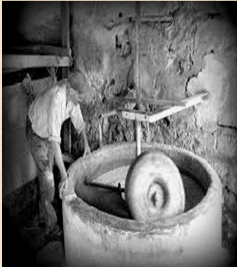
Νικάνδρα - Δήμητρα

Οι άνθρωποι από τότε που ανακάλυψαν το σιτάρι και τα άλλα δημητριακά, βρέθηκαν στην ανάγκη να το αλευροποιήσουν για να κάνουν το ψωμί και τα γλυκά τους. Ο πρώτος μύλος ήταν 2 επιφάνειες, που χτυπιούνταν μεταξύ τους, π.χ. 2 πέτρες (εάν στη μέση βάλουμε σπόρους, αυτοί, με πολλά χτυπήματα γίνονται σκόνη). Μετά βρέθηκε ο τρόπος της τριβής και τέλος της περιστροφής, με τις γνωστές μυλόπετρες. Η κάτω πέτρα ήταν σταθερή κι η πάνω περιστρεφόταν. Η περιστροφή σε μικρό μύλο γινόταν με το χέρι και με δύναμη ζώου, αέρα ή νερού.