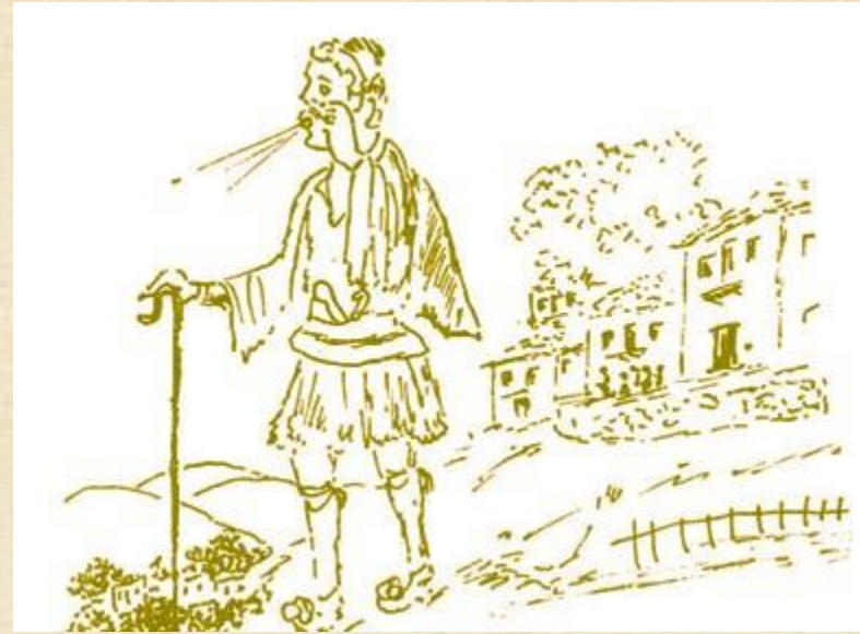
Παναγιώτης - Δημήτρης

Σήμερα που υπάρχουν τα μεγάφωνα δε χρειάζεται ο ντελάλης. Τους συναντάμε στις λαϊκές αγορές, που βροντοφωνάζουν τηνπραμάτεια ή τα προϊόντα τους.