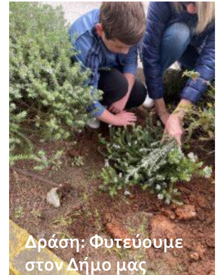
Δράση: Φυτεύουμε στον Δήμο μας