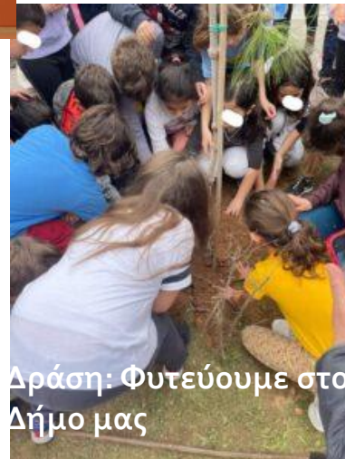
Δράση: Φυτεύουμε στον Δήμο μας