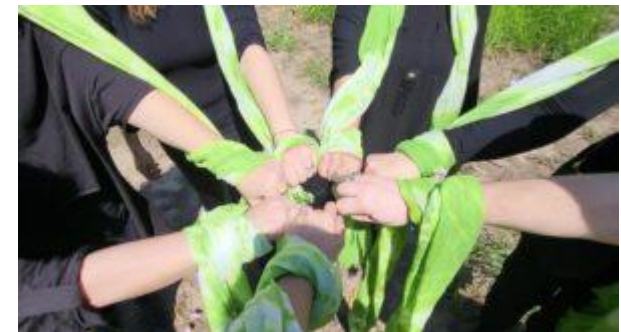
Δράση: Στα χνάκια της γης! Art for Earth