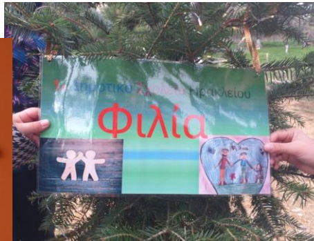
Δράση: Φυτεύουμε και υιοθετούμε το έλατο της φιλίας