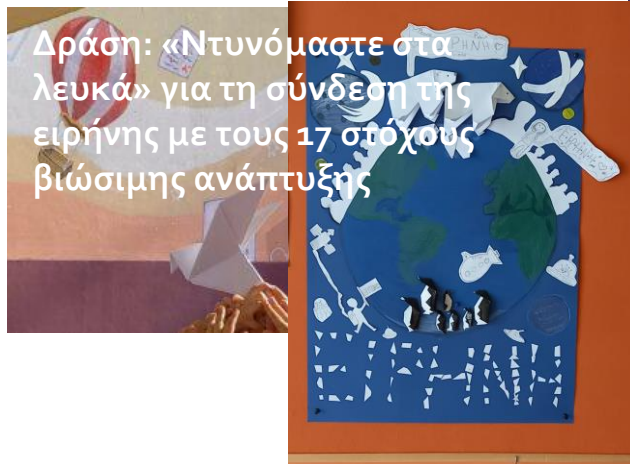
Δράση: «Ντυνόμαστε στα λευκά» για τη σύνδεση της ειρήνης με τους 17 στόχους βιώσιμης ανάπτυξης