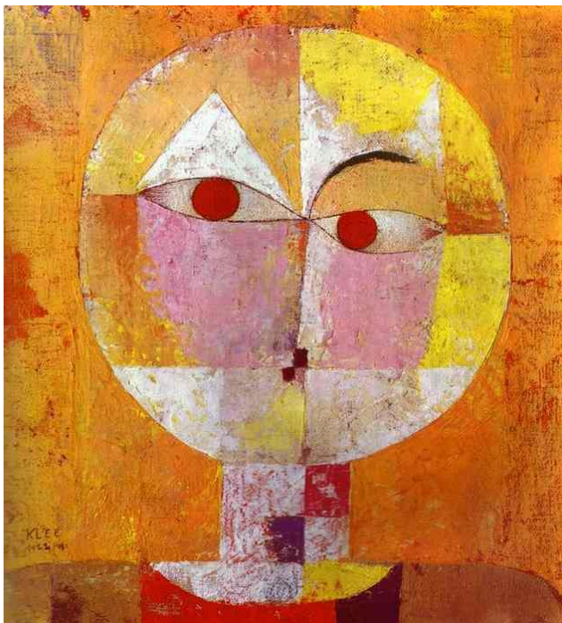
Senecio 2 , 1922, Βασιλεία, Kunstmuseum