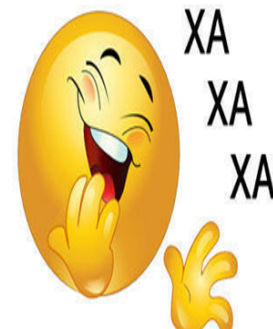
Το ανέκδοτο της ημέρας