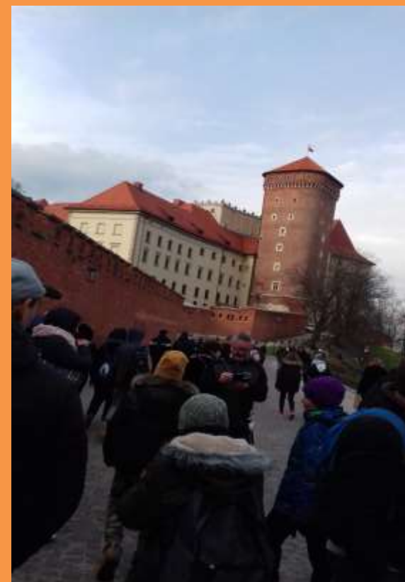
ΚΡΑΚΟΒΙΑ ΚΑΙ ΑΛΑΤΟΥΡΧΕΙΑ ΒΙΛΙΤΣΚΑ