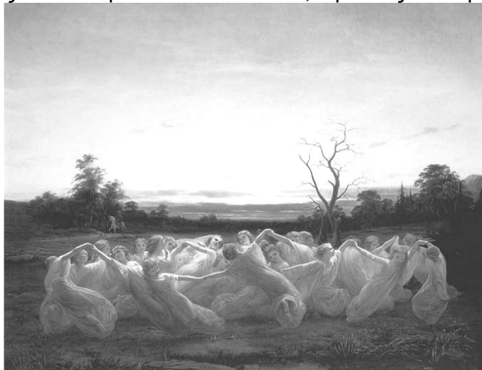
Ξωτικά των Λιβαδιών από το Νιλς Μπλομέρ

Ή τέλος θεωρούνται γενικά ως ξωτικά της φύσης: Φαύνοι, Σάτυροι, Νεράιδες των λουλουδιών, Δρυάδες των δέντρων και των δασών, Ορεάδες των ορέων