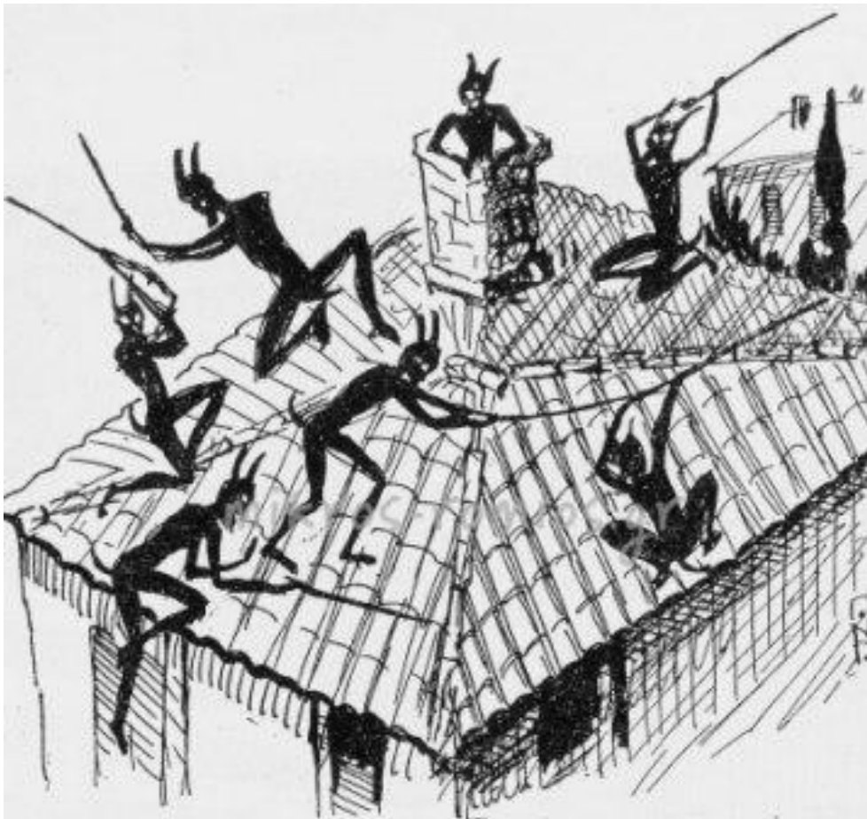
Καλικάντζαροι, εικόνα από τον Μικρό Ρωμικό , ηλεκτρονική εφημερίδα για την Αθήνα, του Μουσείου της πόλεως των Αθηνών

Από τόπο σε τόπο, ο μύθος των καλικαντζάρων έχει και τις δικές του ιστορίες και παραλλαγές. Οι καλικάντζαροι θεωρούνται πλάσματα της νεοελληνικής μυθολογίας, αλλά οι ρίζες του μύθου χάνονται στο χρόνο. Οι αρχαίοι Έλληνες πίστευαν πως οι ψυχές των νεκρών όταν έβρισκαν τις πόρτες του κάτω κόσμου ανοιχτές, το έσκαγαν, ανέβαιναν επάνω και τριγύρναγαν παντού κάνοντας ό,τι θέλουν, αργότερα και οι Βυζαντινοί τριγύρναγαν μασκαρεμένοι στους δρόμους, πείραζαν τους περαστικούς και μπαίνανε στα σπίτια απροσκάλεστοι. Παρόμοιους μύθους θα βρούμε όμως και σε άλλες χώρες βασισμένους στα δικά τους ήθη και έθιμα.