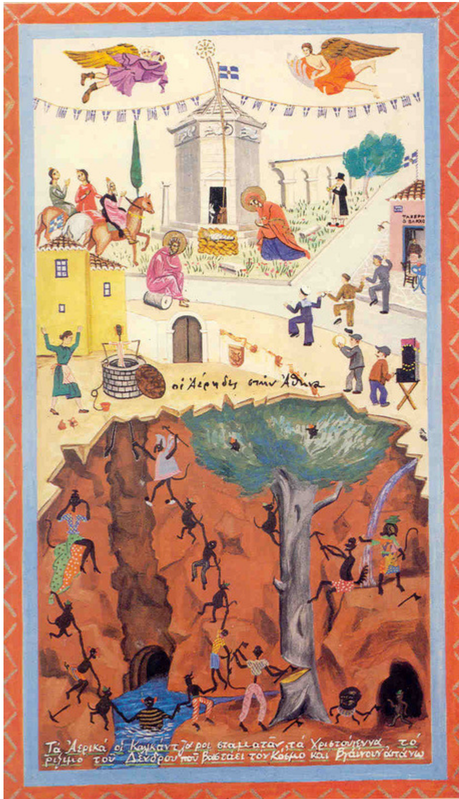
Το δέντρο του κόσμου και η έξοδος των καλικατζάρων στον πάνω κόσμο μέσα από ένα πηγάδι. Πίνακας των Χριστουγέννων του Π. Τέτση από το βιβλίο του Θ. Βελλούδιου Αερικά, ξωτικά και καλικατζαροι.