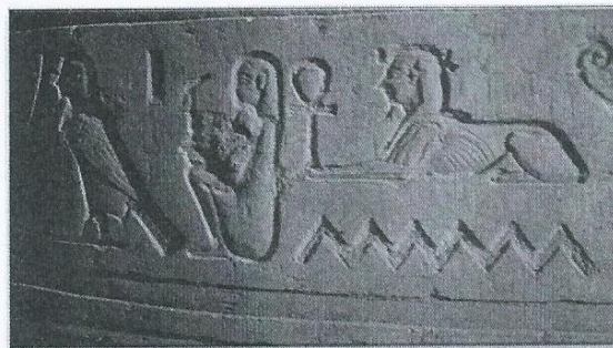
Ιερογλυφικά από τον Ναό του Φίλε (Αίγυπτος)