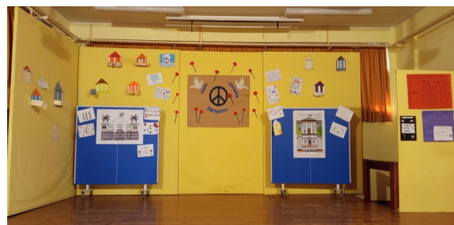
Τα σκηνηκά της γιορτής μας

Φέτος στο σχολείο μας ανήμερα της επετείου του Πολυτεχνείου οι μαθητές της Ε Δημοτικού υπό την καθοδήγηση των δασκάλων τους παρουσίασαν μία άκρως συγκινητική γιορτή. Μέσα από τα κείμενα και τα τραγούδια που ακούστηκαν προσπάθησαν να αποδώσουν τον αγώνα των φοιτητών για την ΕΛΕΥΘΕΡΙΑ, ΠΑΙΔΕΙΑ, ΔΗΜΟΚΡΑΤΙΑ δηλώνοντας ότι τίποτα δεν πρέπει να θεωρείται δεδομένο. Μερικά από τα τραγούδια που ακούστηκαν είναι τα Μαλαματένια λόγια (στίχοι Μάνος Ελευθερίου, μουσική Γιάννη Μαρκόπουλου), Τα παιδιά ζωγραφίζουν στο τοίχο (στίχοι Μιχάλης Μπουρμπούλης, μουσική Γιώργος Χατζηνάσιος), Ο δρόμος είχε την δική του ιστορία (στίχοι Κωστούλα, μουσική Μάνος Λοΐζος). Να σημειωθεί ότι στα τραγούδια τους μαθητές συνόδευσε με την κιθάρα της η μουσικός του σχολείου κ. Νατάσα Μουσάδη. Ήταν 21 Απριλίου του 1967 όταν λίγοι αξιωματικοί των Ενόπλων Δυνάμεων επιβάλλονται στο στρατό και τον χρησιμοποιούν για να πάρουν την εξουσία της χώρας και να επιβάλουν την δικτατορία. Επικεφαλής της Χούντας είναι ο Παττακός, ο Παπαδόπουλος και ο Μακαρέζος οι οποίοι απαγορεύουν την κυκλοφορία της μεταμεσονύκτιες ώρες και τις συγκεντρώσεις πάνω από 5 άτομα.