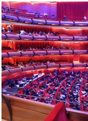
Η εντοπωσιακή αίθουσα της Λυρικής

Η αίθουσα ήταν τεράστια και με πολλά όμορφα φώτα.