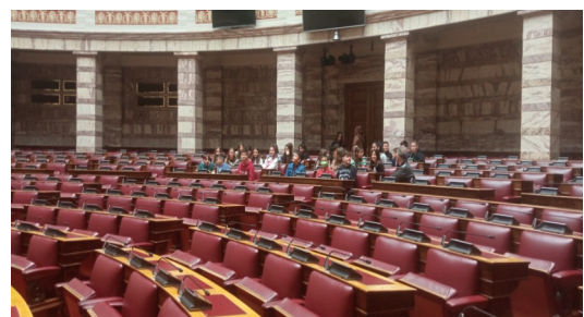
Η αίθουσα ολομέλειας της Βουλής

Εύχομαι και ελπίζω να επισκεφθούμε πάλι αυτό το υπέροχο χώρο ξανά με το σχολείο μας. .