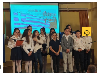
Οι μαθητές του Στ1

Κάθε χρόνο έτσι και φέτος το σχολείο μας στις 27 Οκτωβρίου τίμησε την ηρωική αντίσταση των Ελλήνων. Το ΣΤ1 με την βοήθεια του δασκάλου τους οργάνωσαν μια γιορτή γεμάτη τραγούδια και ποιήματα. Μερικά από τα τραγούδια που ακούστηκαν ήταν :«Βάζει ο Ντούτσε τη στολή του», «ΠΑΙΔΙΑ ΤΗΣ ΕΛΛΑΔΟΣ ΠΑΙΔΙΑ». Ανάμεσα στα τραγούδια που ακούστηκαν οι μαθητές απήγγειλαν τα ποιήματα τους και γέμισαν με αισθήματα πατριωτισμού και εθνικής περηφάνιας την αίθουσα εκδηλώσεων. Στο τέλος της γιορτής το κοινό χειροκρότησε τους μαθητές για την άψογη γιορτή.