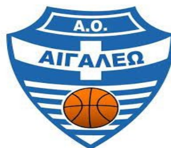
Το έμβλημα της ομάδας μπάσκετ του Αιγάλεω.