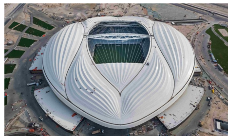
Το στάδιο AL Janoub στο Al Βακράχ