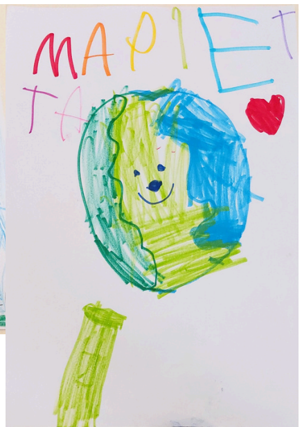
“ΜΙΑ ΓΗ ΧΑΡΟΥΜΕΝΗ ΓΙΑ ΤΑ ΠΑΙΔΙΑ”