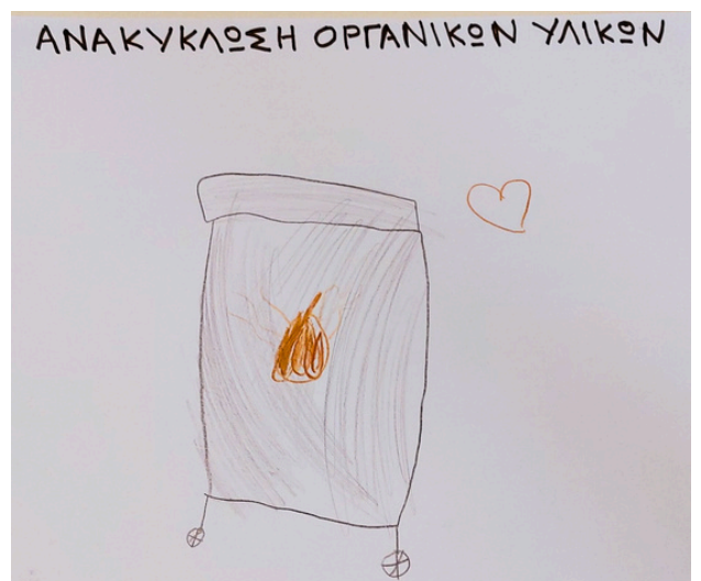
“ΑΝΑΚΥΚΛΩΝΟΥΜΕ ΟΡΓΑΝΙΚΑ ΥΛΙΚΑ”

ΕΦΗΜΕΡΙΔΑ ΓΙΑ ΤΟ ΠΡΟΓΡΑΜΜΑ ΠΕΡΙΒΑΛΛΟΝΤΙΚΗΣ ΕΚΠΑΙΔΕΥΣΗΣ ΜΕΣΑ ΑΠΟ ΤΑ ΜΑΤΙΑ ΤΩΝ ΠΑΙΔΙΩΝ