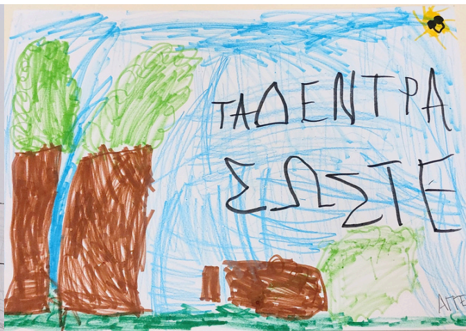
“ΤΑ ΔΕΝΤΡΑ ΣΩΣΤΕ”