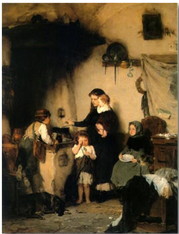
Του Ν. Γύζη «Τα ορφανά»

Αρχικά ξεκινήσαμε με την παρατήρηση των δύο πινάκων: