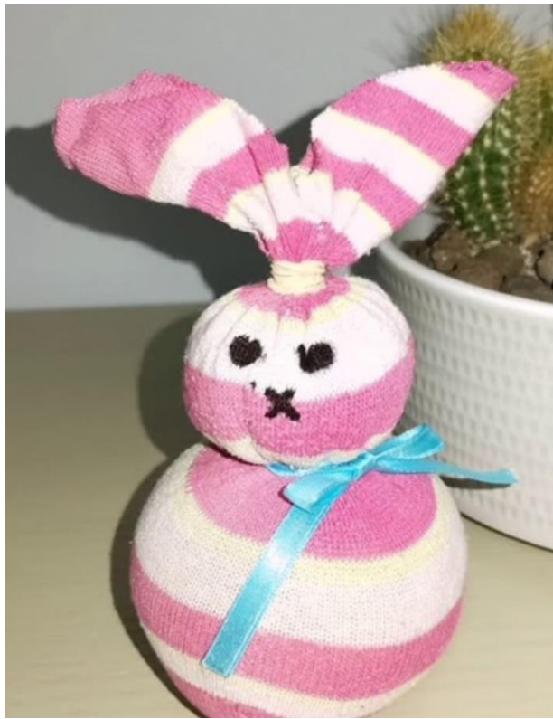
Με μια παλιά κάλτσα και ρύζι