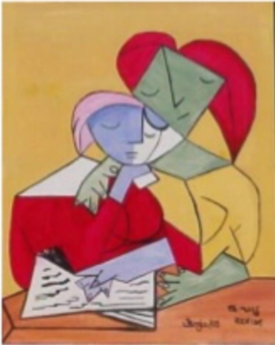
« Two Girls Reading » Pablo Picasso