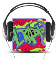
ΕΠΙΣΤΗΜΟΝΙΚΗ ΕΤΑΙΡΕΙΑ «European School Radio, Το Πρώτο Μαθητικό Ραδιόφωνο»