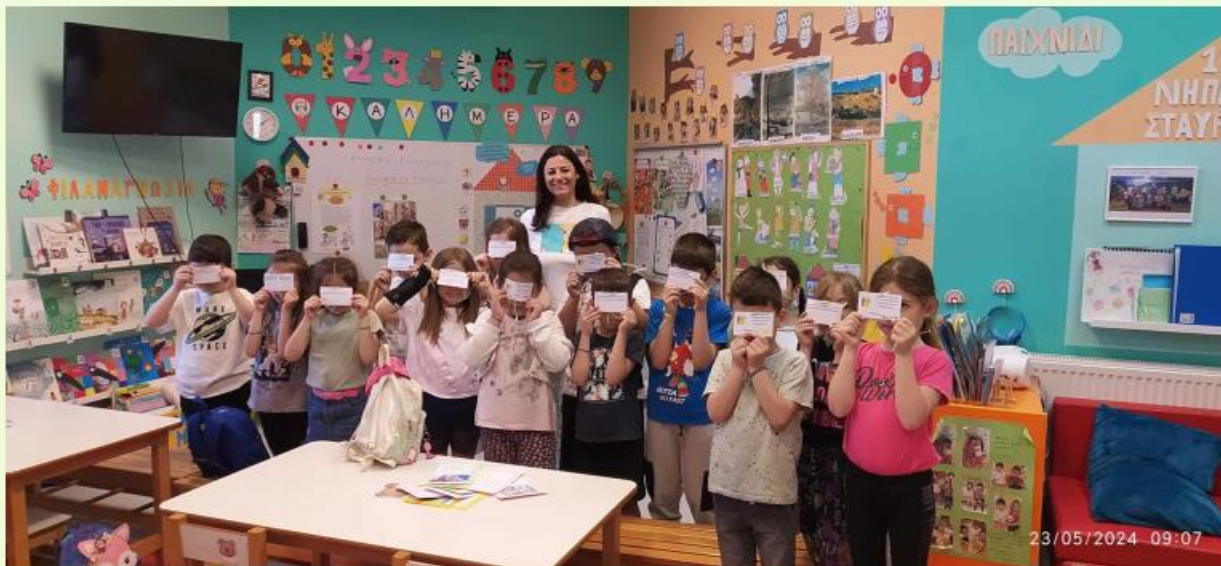
2 ο εργαστήριο φιλιαναγνωσίας: «Αινίγματα για παραμύθια»