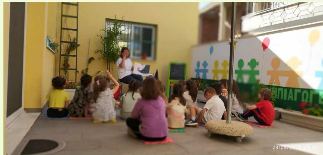
Παρουσίαση του δικού μας βιβλίου στα τμήματα της Α΄ Δημοτικού