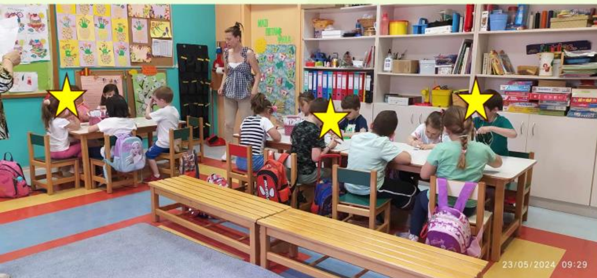
1 ο εργαστήριο φιλιαναγνωσίας: «Κατασκευάζω σελιδοδείκτες»