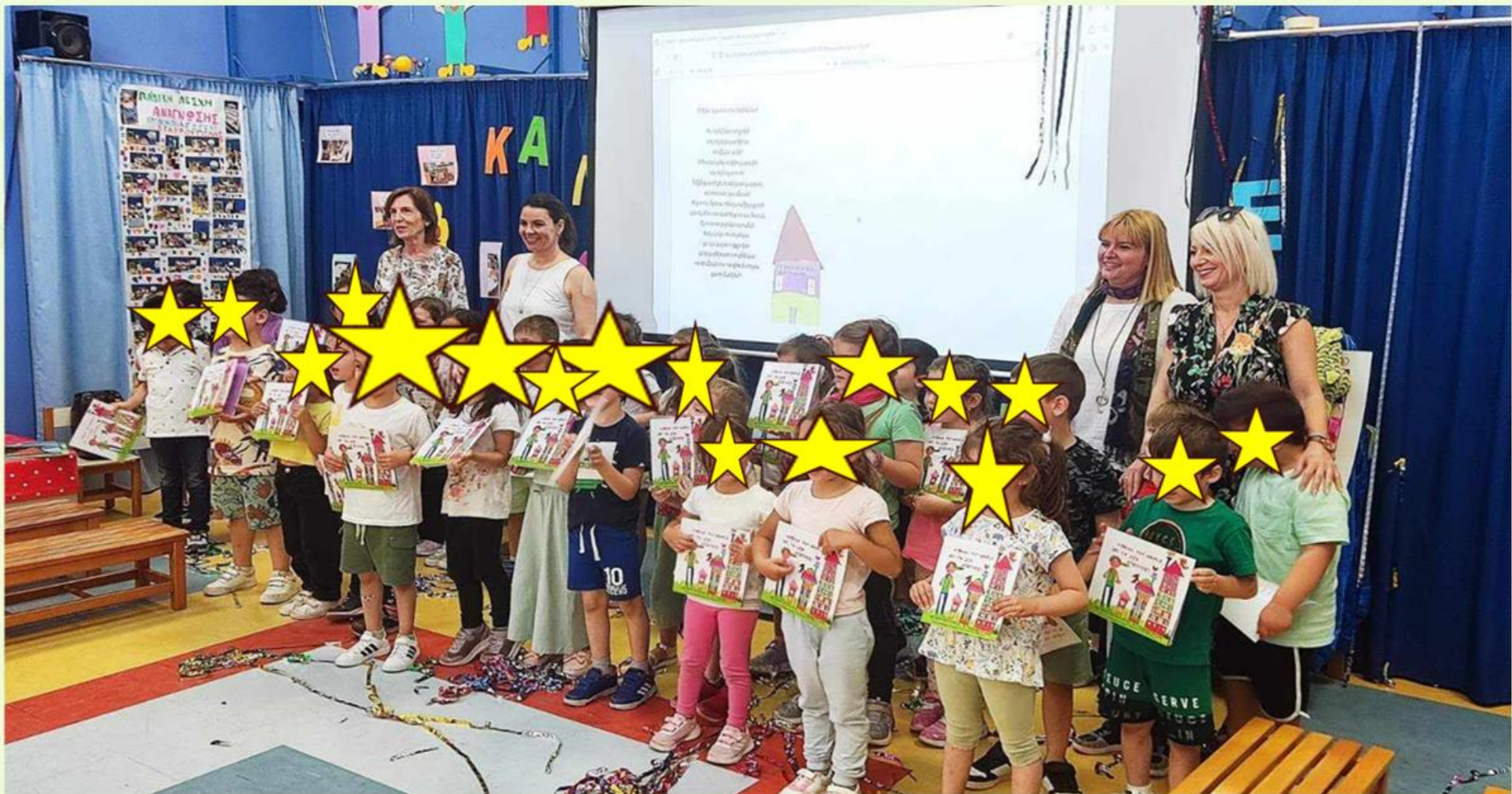
Η συγγραφική ομάδα του σχολείου μας!!!