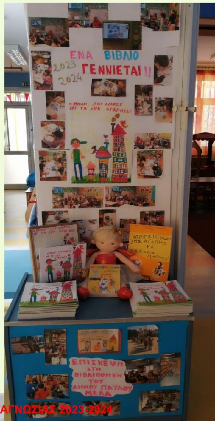
17ο ΝΗΠΙΑΓΩΓΕΙΟ ΣΤΑΥΡΟΥΠΟΛΗΣ ΠΡΟΓΡΑΜΜΑ ΦΙΛΑΝΑΓΝΩΣΙΑΣ 2023-2024